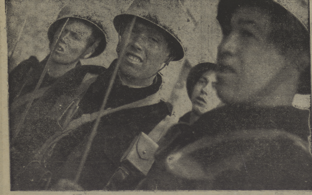
Preparados, con las bayonetas caladas, los obreros del ejército que lucha en el frente de Guadalajara, esperan la orden de atacar.

Para esta tarde estaba anunciada una interesante sesión de cine, en la Sala Mozart, organizada, como lag de los demás domingos, por el Roig-Cine club a base de un programa de films americanos. Las dificultades surgidas a última hora de anoche, motivan el aplazamiento de esta sesión hasta el próximo domingo. Todos los camaradas sabrán hacerse cargo de lo involuntaria que es esa dificultad que será subsanada inmediatamente.