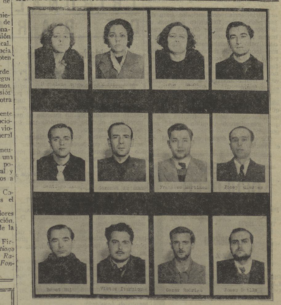
Los complicados en la red de espionaje fascista, detenidos en Barcelona hace algunos días, y de cuyas actividades d'imos cuenta oportunamente.