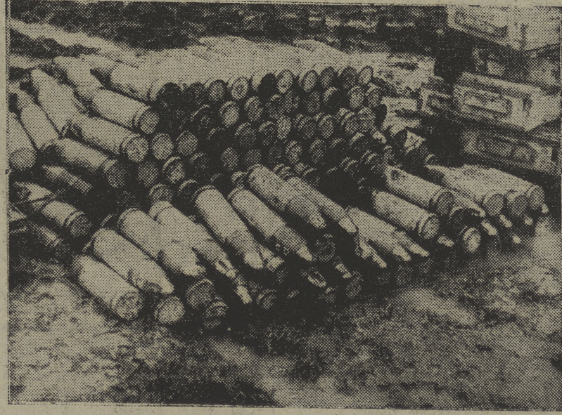
Un espectáculo familiar para nuestros bravos milicianos: depósitos de municiones fabricadas en Italia, y abandonadas en la famosa retirada.

El trabajo de fortificación constituye hoy la primera actividad en las proximidades de las líneas de fuego. Hace calor. Pero se reciben con agrado los rayos del sol. Y ni el pico ni la pala descansan un instante.