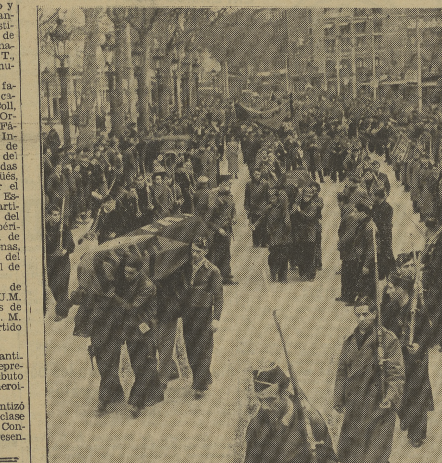
Los compañeros de las víctimas del fascismo llevaban los ataúdes en hombros...