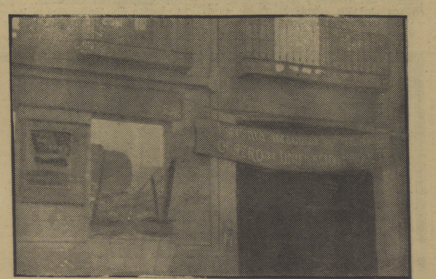
Como el bombardeo de los fascistas ha dejado la imprenta de nuestro querido colega de Madrid «El Combatiente Rojo»