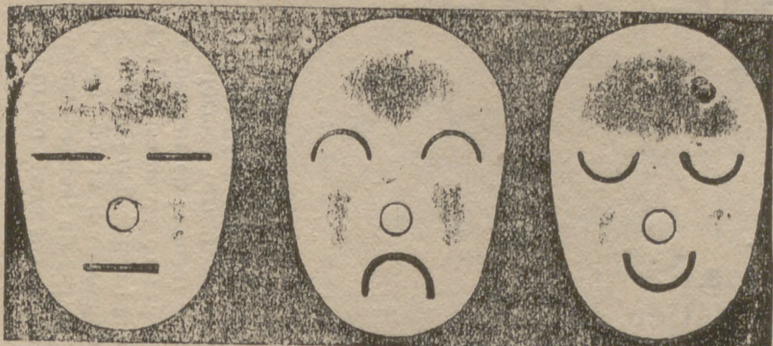
Yo vivía en paz, ni envidiado ni envidioso. Y sin pensarlo, me enamoré ciegamente. Y ¿qué ocultarlo? Me casé.