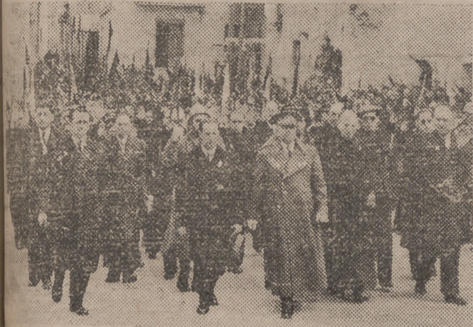
El ministro del Ejército, general Varela, durante la bendición e inauguración de la Cruz de los Caídos levantada ante las ruinas del Seminario de Teruel.