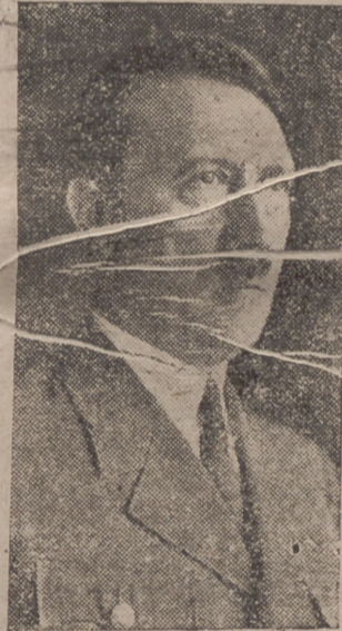
RESISTIENDO CONTRA 26 ESTADOS

Hitler expuso seguidamente las consecuencias de este engaño cometido por Inglaterra y Francia.