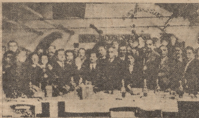
Un grupo de invitados a la comida de hermandad con los obreros de la "INDUSTRIA VIDRIERA".

El simpático acto constituyó un exponente del sano espíritu patriótico que debe reinar en todas las industrias nacionales