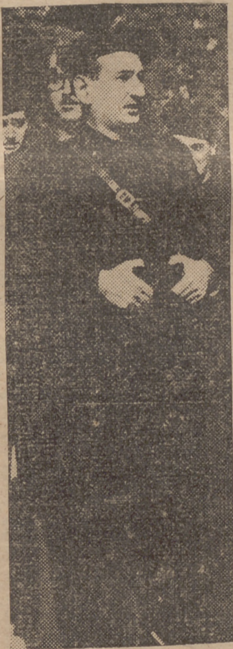
El Jefe provincial del Movimiento, camarada José Luis Arrese, pronunciando su vibrante discurso.