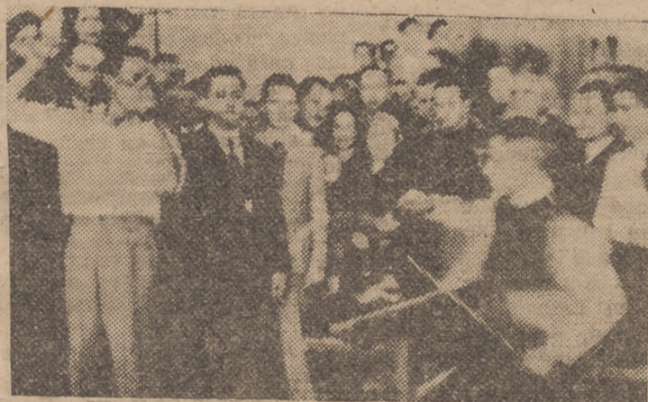
Ante los invitados, los obreros muestran su pericia en el trabajo del vidrio.

Mi deseo máximo se condensa en ver convertida esta fábrica en lo que ya es hoy nuestra auténtica España, síntesis gloriosa de nuestro genial CAUDILLO, en estas horas de la paz y de la re-