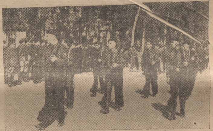
Las centurias de la Falange malagueña desfilando ante el Jefe provincial del Movimiento.

Formados en centurias y en columnas de seis en fondo, marcharon todos al Parque de Martiricos, donde ha-