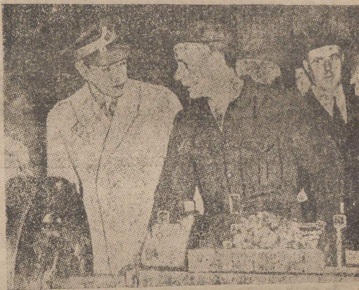
El Rey Jorge VI charlando con un obrero inglés durante la visita que realizó días pasados a una fábrica de material de guerra.