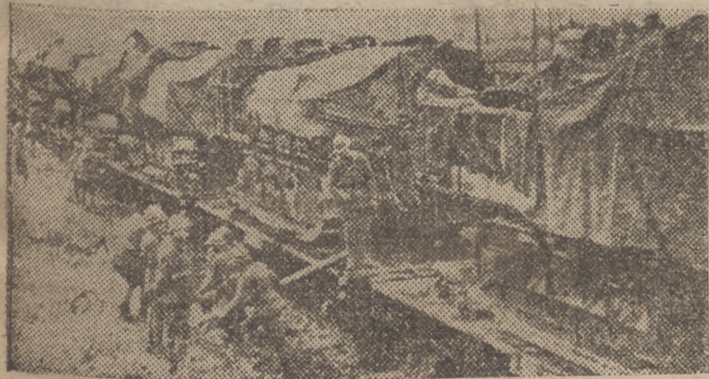
CARRS DE ASALTO Y TRACTORES FRANCESES TRANSPORTADOS POR FERROCARRIL ESTRATEGICO HASTA LAS AVANZADAS DE LA FAMOSA LINEA MAGINOT