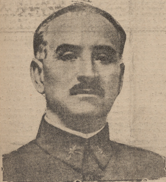
GENERAL QUEIPO DE LLANO