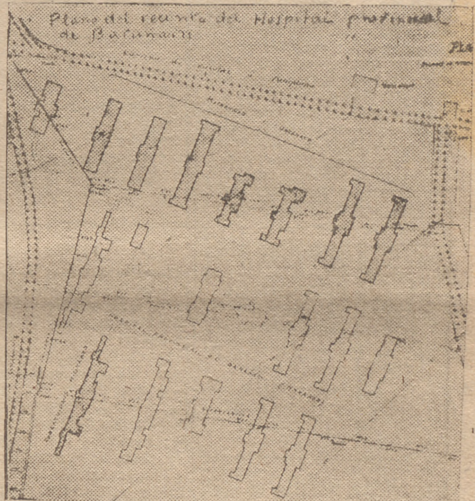
Plano del terreno para un hospital y residencia de ciegos en Barañain (Navarra), al que se refiere un artículo del ilustre general Martínez Anido, que publicamos en las páginas centrales de este número