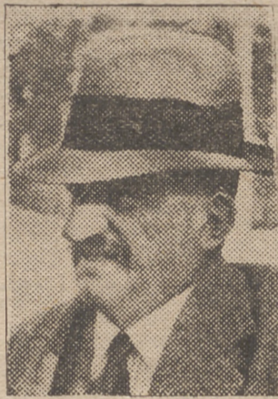
El conde de Romanones

Con una flota propia o ajena, España tiene en sus manos la comunicación de Francia con su gran Imperio africano, de treinta millones de kilómetros cuadrados de extensión y con sesenta y cinco