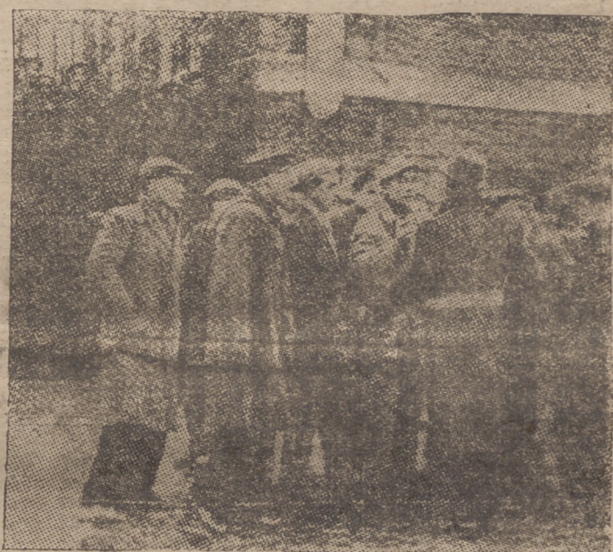
El comisario de Policía de Valenciennes discute con los delegados sobre la evacuación de una de las numerosas fábricas en las que los huelguistas se han hecho fuertes