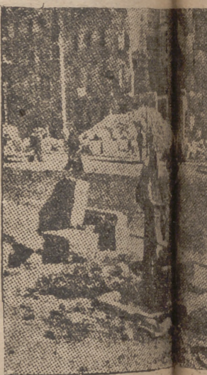
Calle de las Cortes de la ciudad limpia y hermosa, en un momento importante, este espectáculo de gobierno.”