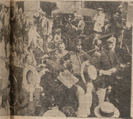
EN BUENOS AIRES.—La capital de la Argentina muestra al triunfador en la travesía del Atlántico, en la fotografía que publicamos

...es de Gual-el-Jelá. Estos... ...a otro de sus hijos en... ...reciente y también del mo... ...más heroico, aparte de un... ...hijo herido en los campos... ...batalla. Además el teniente... ...brillan... ...y un... ...a la flor de la... ...nacional.