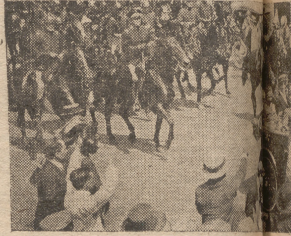
LOS TRIPULANTES DEL "PLUS ULTRA" BIENOS AIBRIBUÓ A LOS GLORIOSOS TRIPULANTES DEL "PLUS ULTRA" UN RECIBIMIENTO APOCÓLÍPTICO, COMO EVIDENCIA DE SU VALOR