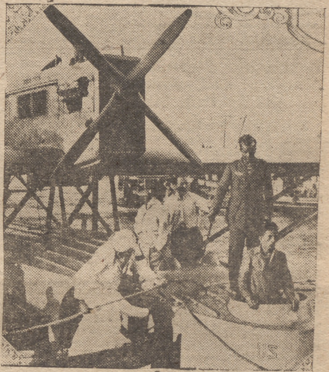
EL FAMOSO VUELO DEL "PLUS ULTRA".—A la llegada del "hidro" a Rio Janeiro, Ramón Franco y sus valientes compañeros realizan las operaciones de amarrado

En las páginas centrales amplia e interesantísima información de este luctuoso suceso.