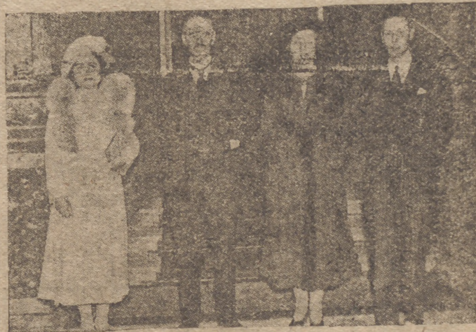
Los soberanos ingleses reciben a Mr. Chamberlain—a quien acompaña su esposa—después del viaje a Munich del primer ministro británico, en el que logró, juntamente con Mussolini, Hitler y Daladier, que la paz sea en Europa una realidad. En esta "foto" histórica, obtenida en el Palacio Real, se observa cómo los monarcas ceden el sitio de honor a su ilustre visitante