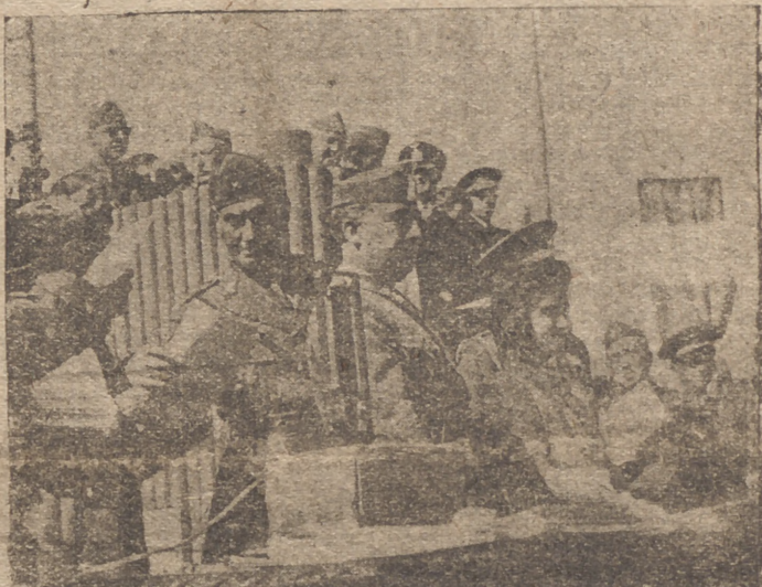
EL GENERALISIMO da lectura, ante el micrófono, al decreto de concesión de Medallas Militares

Entrega de condecoraciones y corbatas militares a los legionarios italianos y 5.º de San Marcial