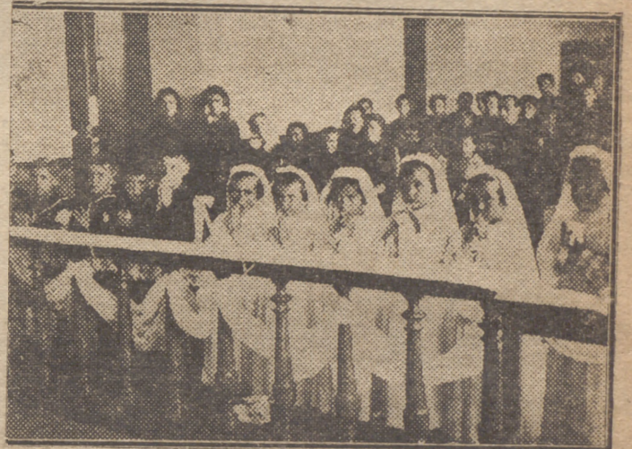
LA OBRA DE "AUXILIO SOCIAL". — Un grupo de niñas y niños acogidos en el Hogar Azul, han recibido por vez primera la Sagrada Comunión