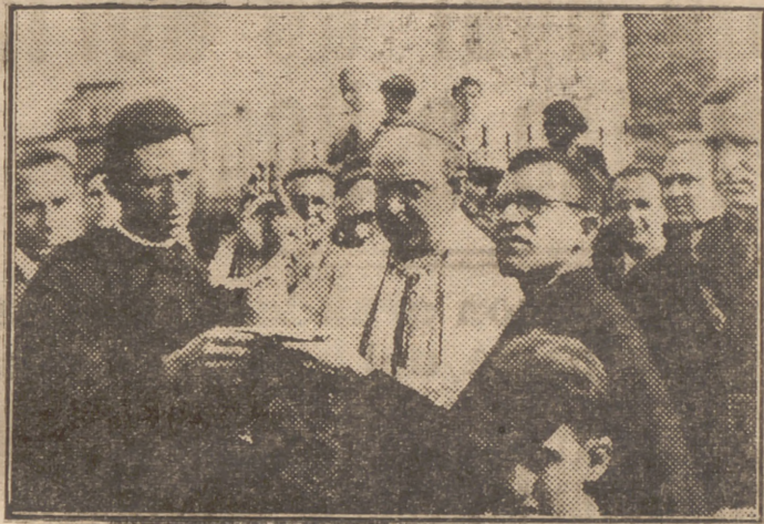
El señor Obispo de Málaga bendice el nuevo grupo escolar de Nuestra Señora del Carmen levantado en las playas de El Palo por Acción Católica de aquella barriada.

Una en su territorio y una en su fe. Libre de las garras extranjeras y libre de esas uñas rapaces de malos españoles que han desgarrado el seno de su propia madre España con su interés personal y sus medros caquiques. Católica, porque desde Santiago a Montserrat, y desde Covadonga, Bergoña y el Pilar hasta Nuestra Señora de Rezfo, Guadalupe y la Puenteña, está pregonando que España fue católica, y en esta cruzada de