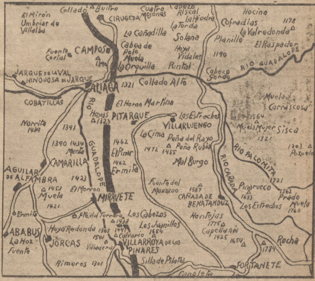
Gráfico del sector del Alfambra, al Norte de Teruel, donde actualmente se desarrollan las operaciones. La línea negra indica la situación en que quedó nuestro frente después del brillante avance de las fuerzas nacionales, que, apesar del mal tiempo, avanzaron en una profundidad de diez kilómetros, ocupando y rebasando los pueblos de Miravete, Villarroya de los Pinares y El Pobo, y otras importantísimas posiciones