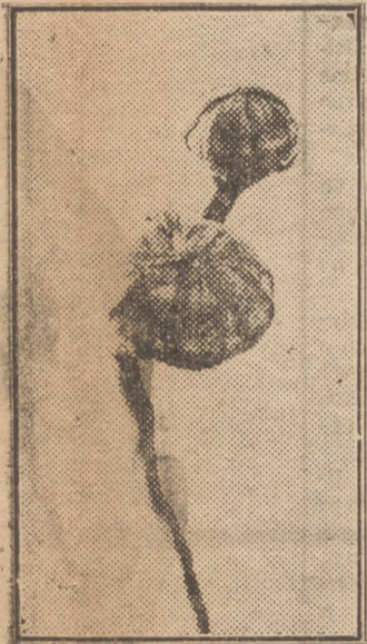
La maravillosa uer de Osiris, antes de abrirse