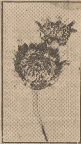
La flor de Osiris, una vez abierta, ofrece a nuestra vista su rara y bella textura.

Jamás dice el investigador pude llegar a sospechar que yo iba a poseer el "gran secreto" tan celosamente guardado por los Faraones, y fue yo, por ser de Dios, no me considero con autoridad para guardarlo, pues si El quiso hacerlo ver a alguien, lo fué para que se conociera su omnipotencia, que yo proclamo desde mi nacimiento, y