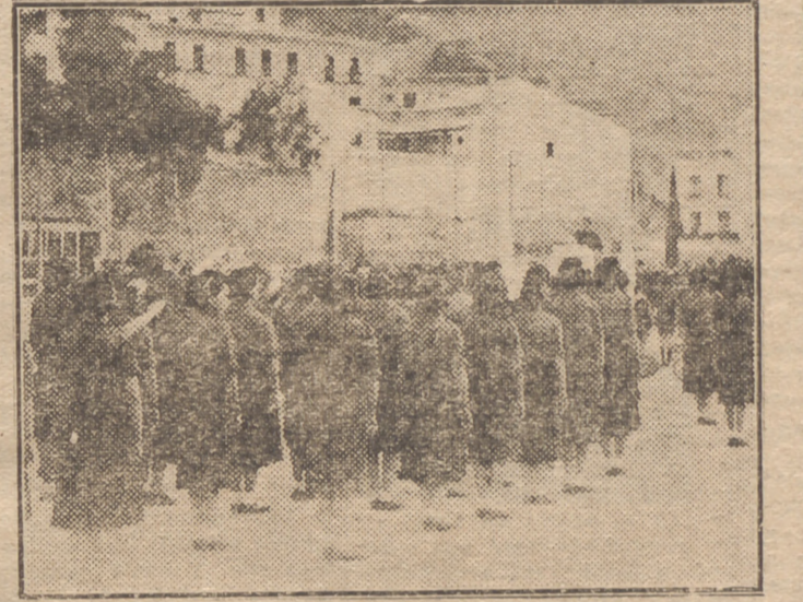
Las Organizaciones Juveniles de F.E.T. de las J.O.N.S., celebraron ayer patrióticos actos conmemorativos del aniversario glorioso del alzamiento nacional del 2 de Mayo de 1938