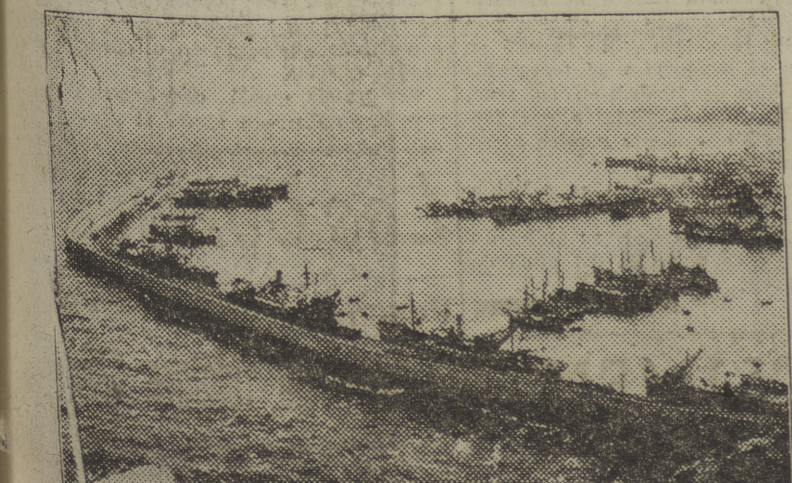
El puerto del Musel, antes de vida próspera, por el que tenían salida los productos asturianos... y por el que han huido los dirigentes marxistas, muchos de los cuales han sido apresados por los marinos de FRANCO