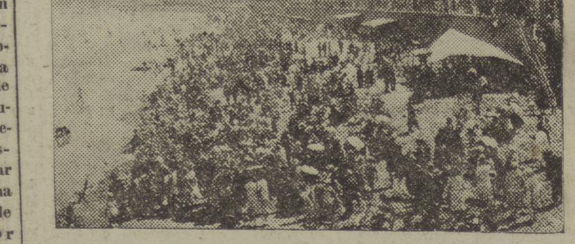
Desde Cimadevilla tiene la playa de San Lorenzo ese magnífico aspecto. Así estaba en los veranos felices anteriores al fatídico 1931... y así volverá a estar en los sucesivos, gracias al esfuerzo de FRANCO

En 6.ª página: Lo que representa Gijón en la vida comercial, con datos interesantes y sensacionales de las acciones del General Aranda sobre la admirable y heroica resistencia de Oviedo.