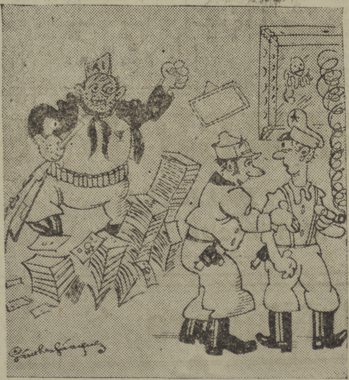
—Oye, ¿Porqué le llaman "El Miliciano Carnaval"? —Porque no ha traído de Asturias más que esos papiillos que les dicen dinero.