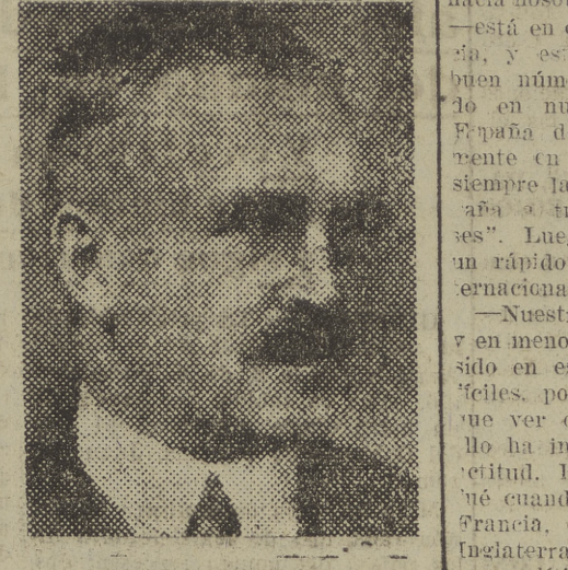
Sir Arnold T. Wilson, figura destacada de la vida política de Inglaterra, militar, diputado y publicista, que se encuentra en la España liberada

Se encuentra en la España liberada el diputado inglés Sir Arnold T. Wilson, una de las figuras más destacadas en la vida política del Reino Unido. Pertenece al grupo Nacional conservador de la Cámara, y representa en ésta a la circunscripción de Hitchin. Es un hombre de acción que ha prestado a su Patria relevantes servicios como militar en activo durante muchos años, y en empresas importantes en los dominios. Sus largas residencias en la India y en Persia han hecho de él un especialista.