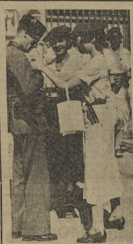
A la complacencia de los donantes en la cuestión realizada ayer con destino a la Asistencia a Frentes y Hospitales, se une este guardia civil, al que un grupo de encantadoras margaritas le impone el emblema de la cruzada. Y es que la Guardia Civil, sobre cumplir los difíciles servicios que la Patria exige de ella, en su aspecto individual tiene en cada uno de sus servidores un corazón generoso y un espíritu abierto a las buenas obras que exalten la solidaridad humana. No habría que decirle esta "foto" para que todos los españoles, y decir esto equivale a decir amantes del benemérito Instituto, estuviéramos convencidos.