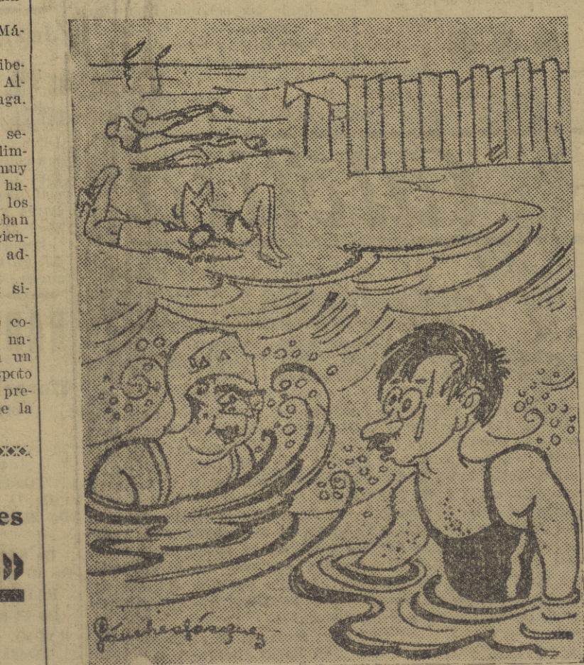
—Mira, Atalúfo, cómo me acariacean las olas. —Sí; el agua del mar ha te nido siempre muy mal gusto.