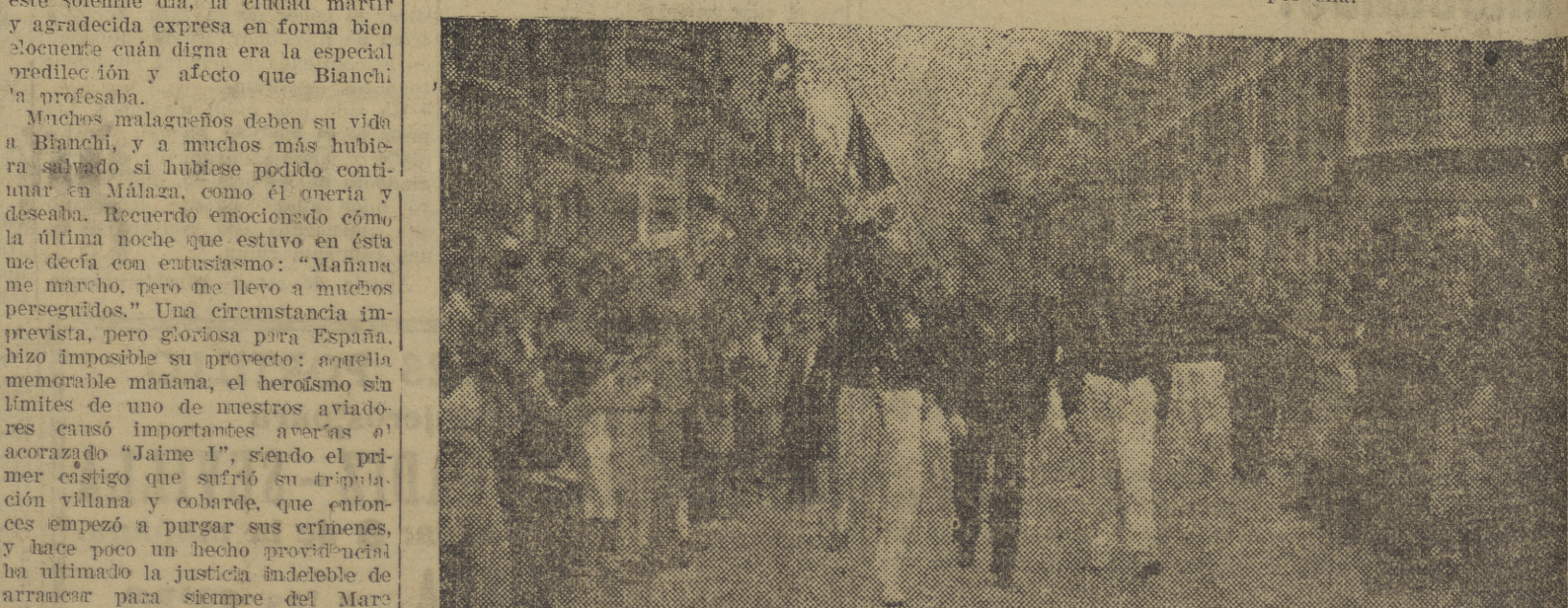
EL CONSUL DE ITALIA RECIBE LAS MANIFESTACIONES DE CARINO, SIMPATIA Y AGRADECIMIENTO DEL PUEBLO MALAGUENO.