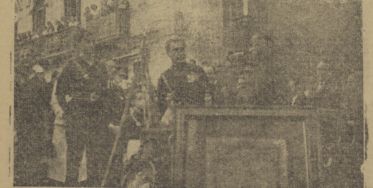
MOMENTO DE SERLE ENTRE GADU AL SEÑOR BIANCHI, POR EL ALCALDE DE MALAGA, EL TITULO DE HIJO ADOPTIVO DE LA CIUDAD.

Una cantidad enorme de público se encontraba en la plaza de J. A. Primo de Rivera y calles adyacentes. Personas de todas las clases sociales asistían entusiasmadas al homenaje al cónsul italiano, encontrándose repletos los balcones próximos. Muchos vivas y ovaciones se prodigaban sin cesar, resultando emocionante el cuadro que se ofrecía a la admiración de todos.