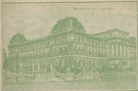
Ministerio de Fomento