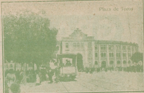
Plaza de Toros