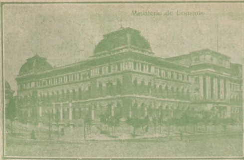
Ministerio de Fomento.