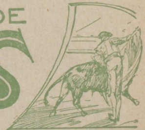
REDACTOR-JEFE JOSÉ M.ª DEL TODO

EL DOMINGO DE RESURRECCION reaparecerá en su ONCE año de publicación