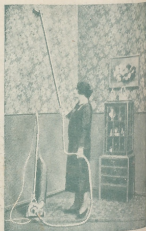
"Dandy" A. E. G. GARANTIZA BRILLO ESPEJO