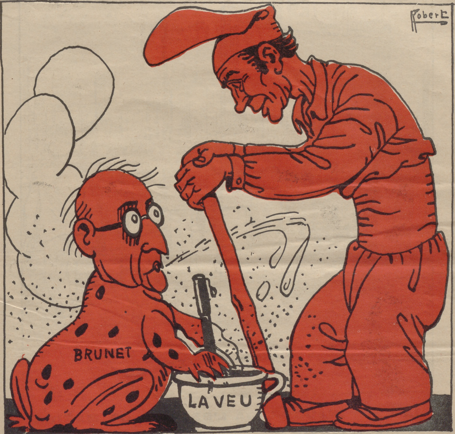
El rabassaire:—Ja veus que el teu bri no arriba enlloc, i amb tu i sense tu nosaltres obtindrem el que és de llei a Catalunya.