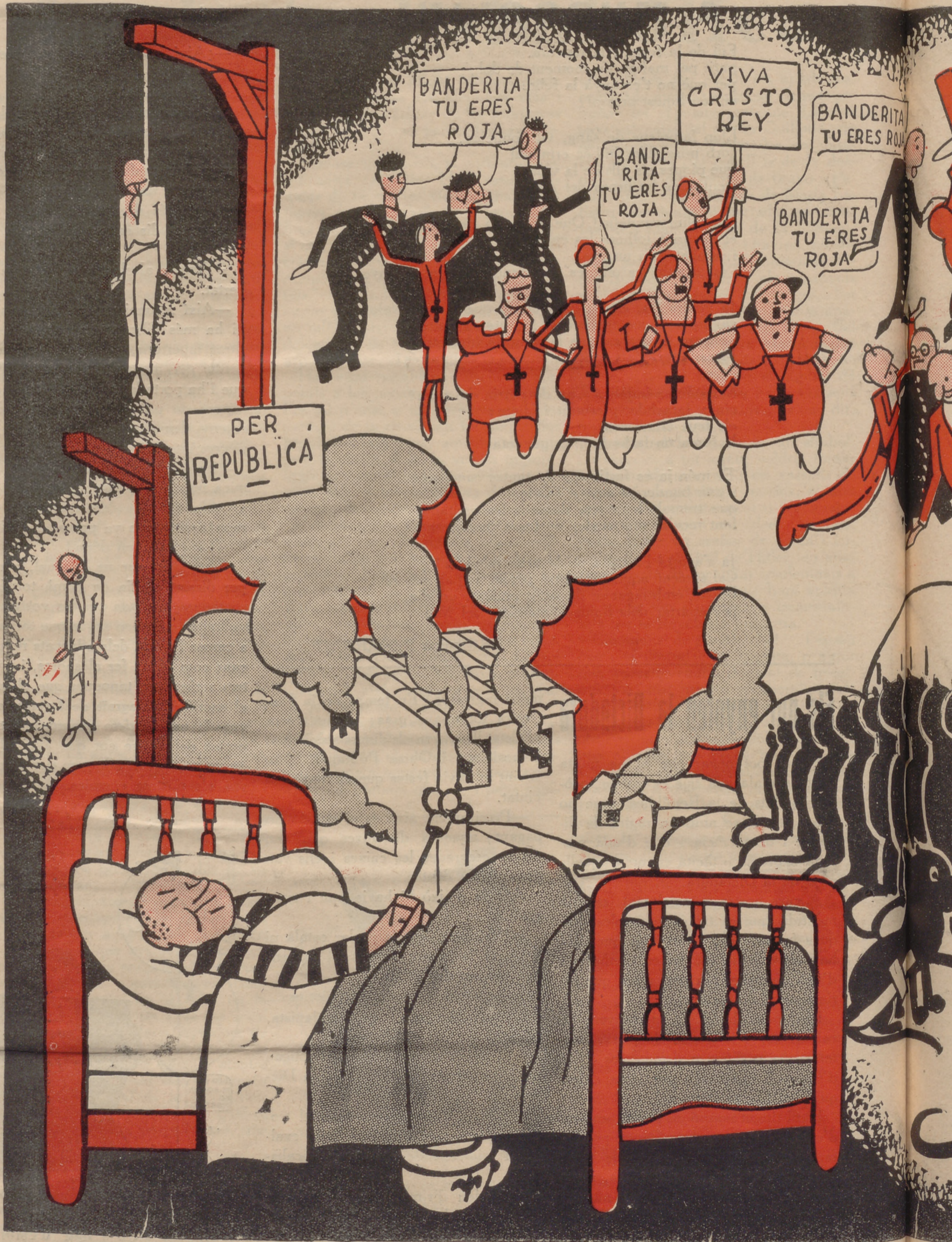
El nou somni d'una nit d'estiu