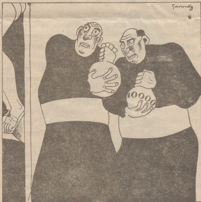
A l'ombra de la creu