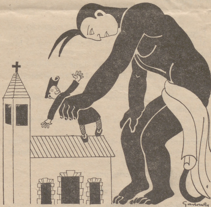
Servidor de Deu i proveïdor del diable

Es visible que l'actitud provocativa sortí dels qui eren dintre el Círcol Tradicionalista. Tan forts van arribar a ésser els crits que es sentiren des del carrer, que el públic començà a aturar-se davant del Círcol, contestant a la provocació dels de dintre amb crits de "Visca la República!". (En aquell moment—segons ens diuen les persones que s'hi trobaven—arribaren dos guàrdies de seguretat,