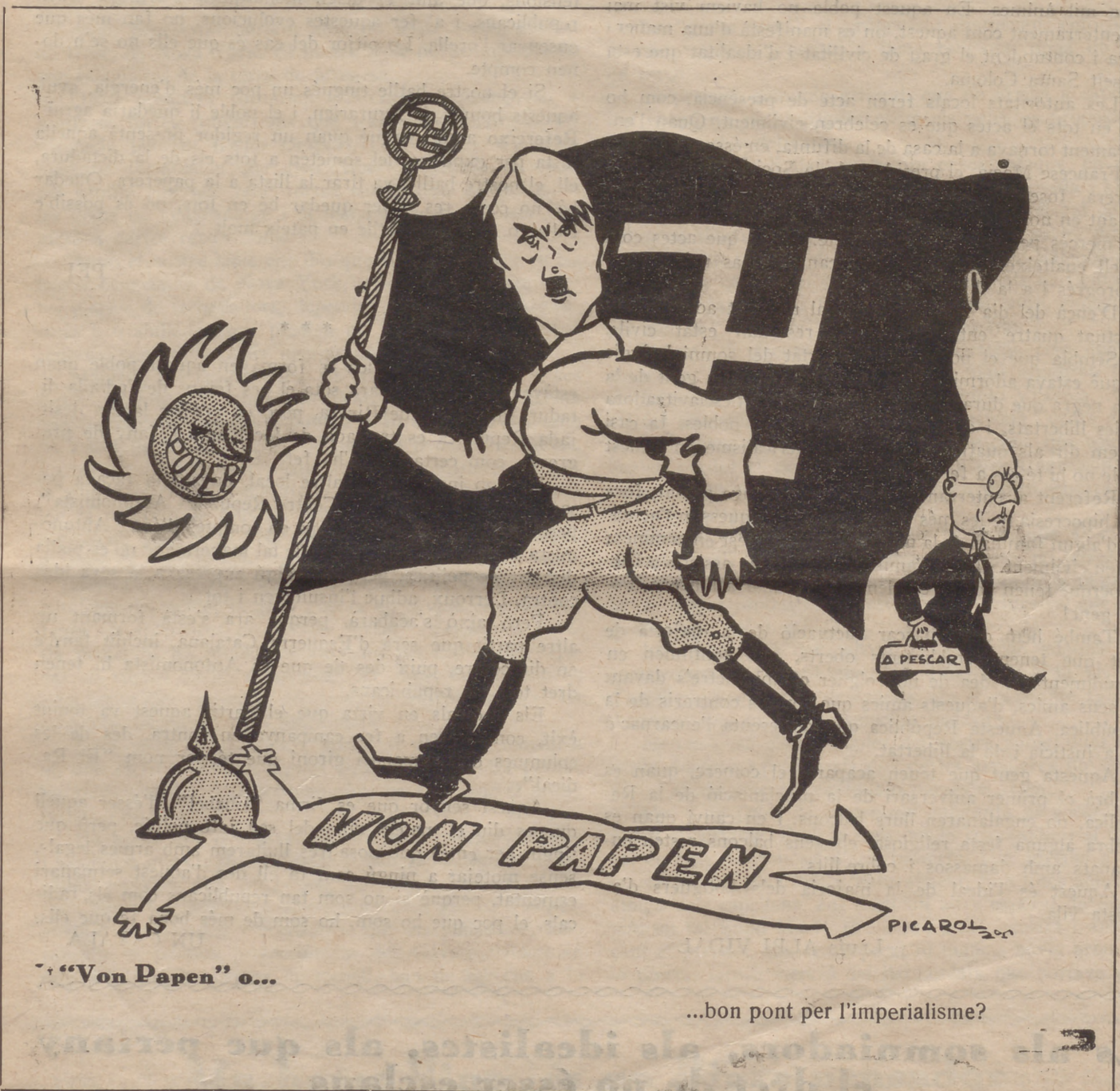
“Von Papan” o...

Imp. “L’Esquella” i “La Campana”, Om, 8. -- Barcelona.