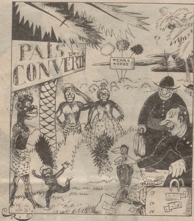
El cap de la tribu: —Em sembla que perdreu el temps. Ací no hi ha diners...

es filtra en la consciència de l'infant.