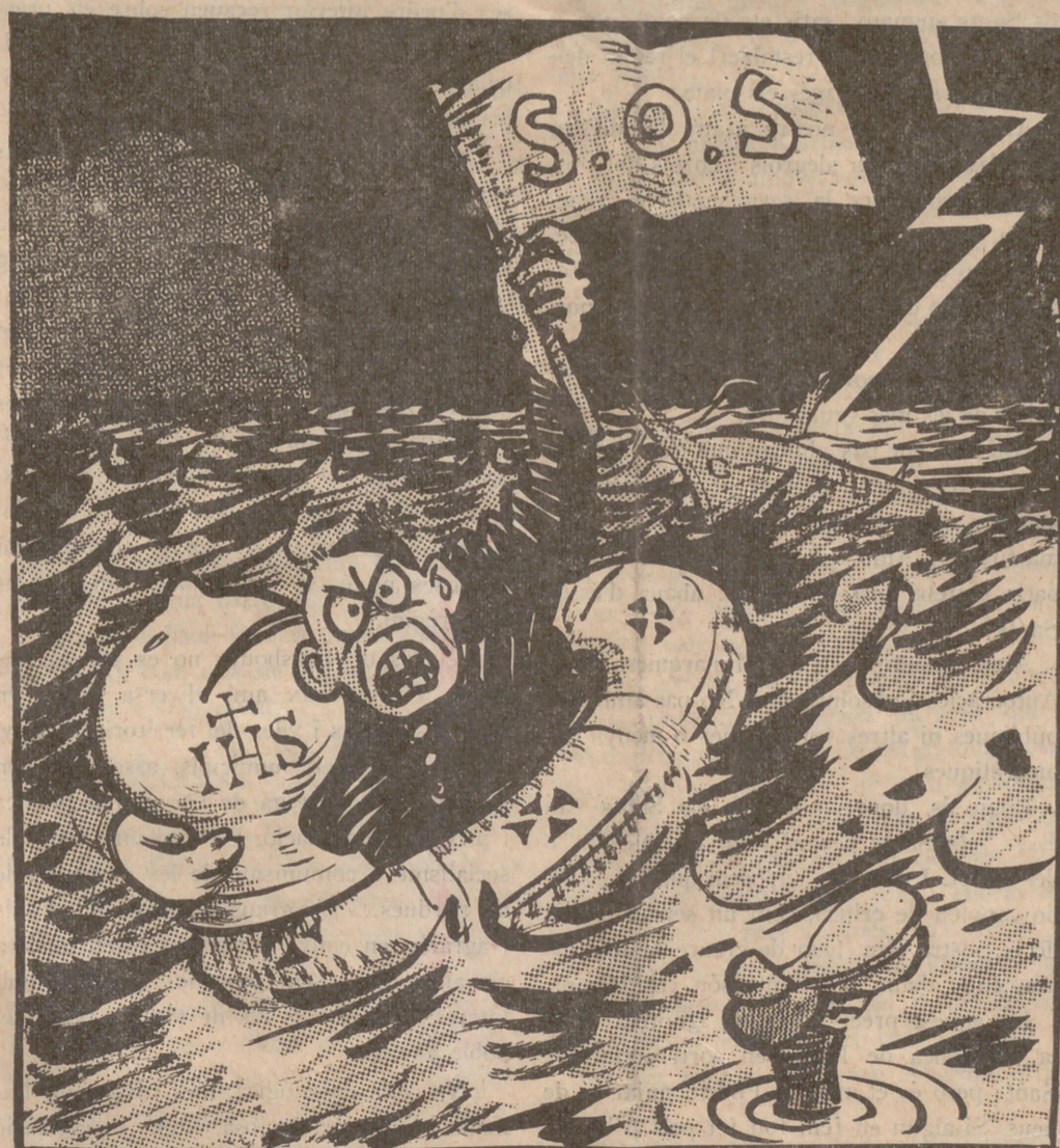
El naufragi d'aquest any

"Con la bruja de la suegra no se podía ver." "La absburgolorenense le echaba en cara a la batembergiana el ser nieta de una bailarina. Como si una bailarina no fuese cien veces más decente que una reina! Como si no hubiera coronas que apenas le sirven a la peor danzante para vaso de noche!" "A los diez años ya lo encontró su madre entre las piernas de una camarera de palacio: suponemos que no sería aprendiendo la doctrina cristiana." "Sus cortesanos decían que era la primera escopeta del reino, porque le habían amaestrado un conejo que se caía cuando oía el tiro del arma regia y reaparecía luego un poco más allá, para volverse a caer al oír otro escopetazo." "Se cambiaba, al día, quince veces de uniforme. Tenía al alcahuete Quiñones de León en París para que le proveyese de carne fresca y de corbatas." "Durante su consulado, España ha sido una Sierramorená poblada de bandidos, de los que Llapisera era el capitán." "A Alfonso XIII basta llamarle rey de Cambó, de Foronda, de Comillas, de Urquijo y otros niños de Ecija, socios industriales suyos o caballeros de industria famosos." "Será para la posteridad escasamente "El Rifeño", el rey del Barranco del Lobo, el rey lobo." "Bruto, en el doble sentido de la palabra, no podía serlo más. Pero castizo, tampoco." "¡Cachonda! — le gri-