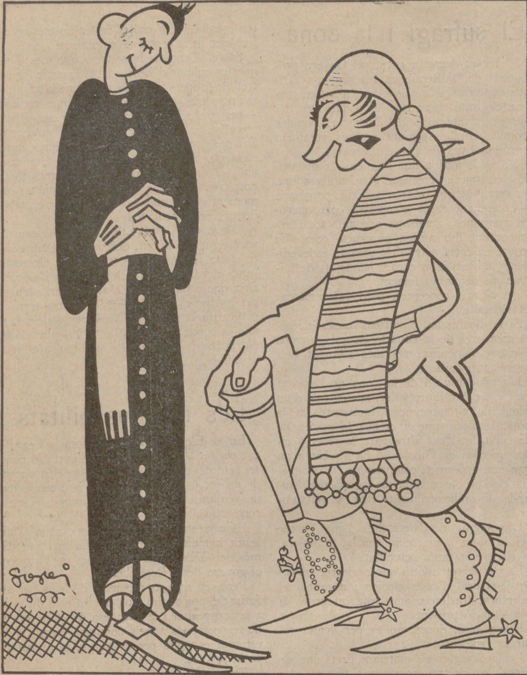
Maneres de viure

El lladre:—Nosaltres vivim dels rics! El capellà:—I nosaltres dels rucs!