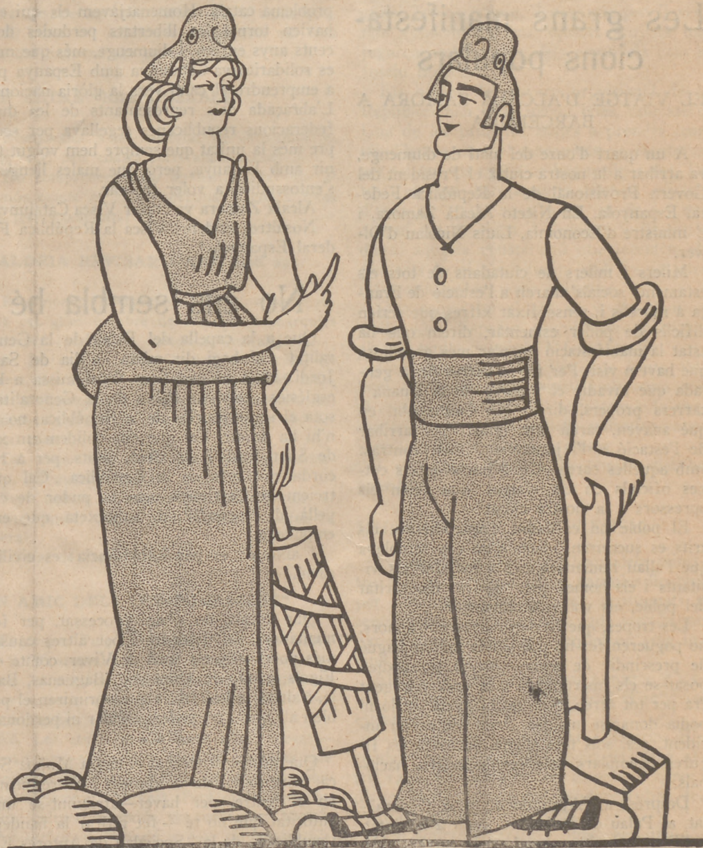
Treball i República