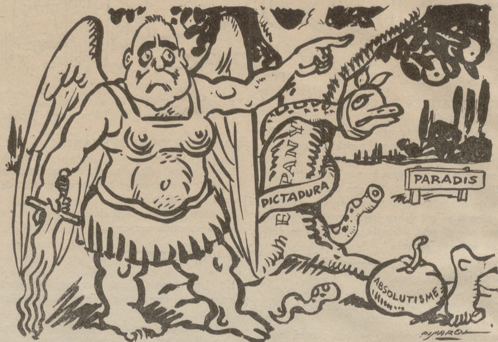
L'home d'avui, de demà...i de sempre!!!