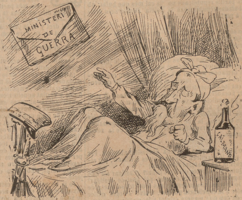
Un que no somia ab altra cosa —Y qui es aquest tipo? —A saberho... á Salamanca.