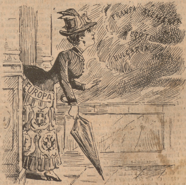
EUROPA:—Está vist que no puch sortir de casa sense parayguas. Tot l' any que amenassa mal temps.