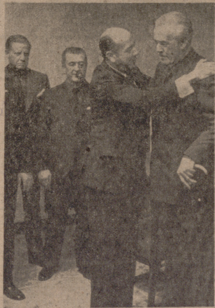
MADRID.—La Junta Nacional de la Confederación de Hermandades y Asociaciones de Excombatientes de España, presidida por don José Antonio Giron de Velasco, ha visitado al ministro secretario general, don José Utrera Molina, en su despacho oficial. En la fotografía, el señor Utrera Molina abraza a Giron durante dicho acto.