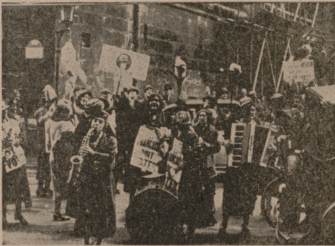
Las mujeres emplearon en la lucha por sus derechos cuantos métodos creyeron podían llamar la atención pública de una u otra manera.

cia, de mano de los movimientos sufragistas de Europa y América, una serie de cambios que habrían de abocar años después en importantes novedades.