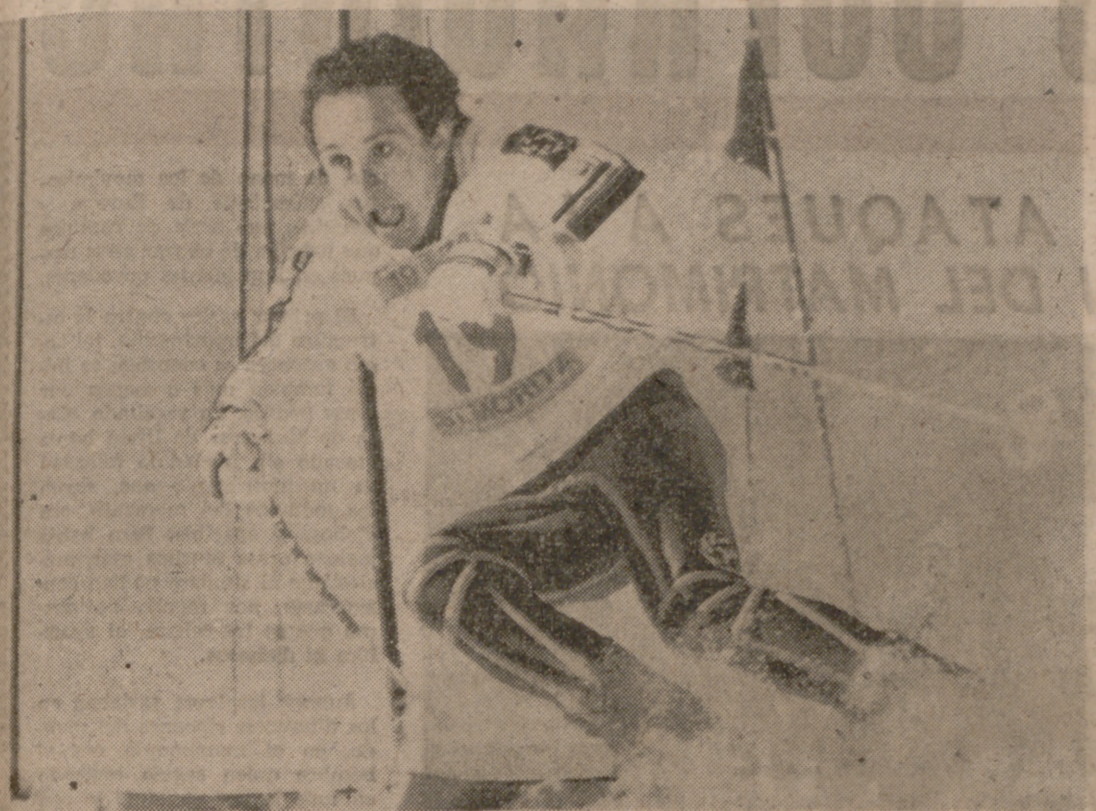
Francisco Fernández Ochoa intentará en la próxima campaña reverdecer sus laureles de campeón olímpico.

En Val d'Isere se celebrarán el día 4 las primeras jornadas puntuables