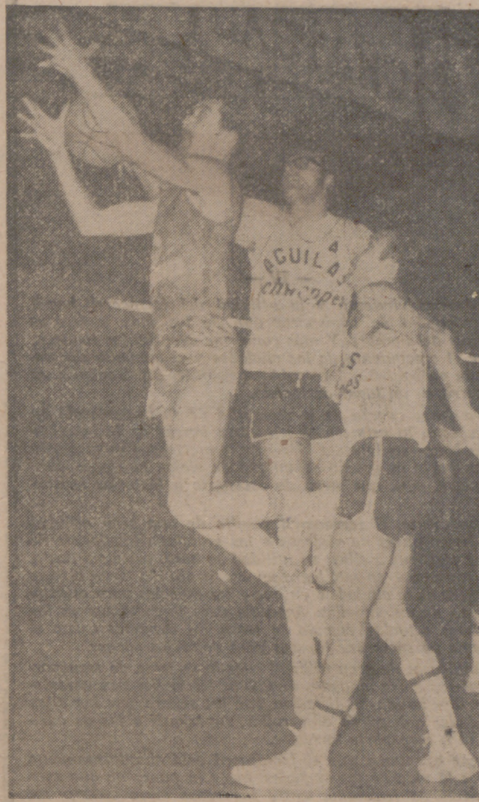
Sten entra imparablemente hacia la canasta enemiga. Una estampa que no se verá mañana.

El Club Atlético Universitario, que también ha hecho su esfuerzo para adquirir un americano, es hasta ahora el máximo anota-