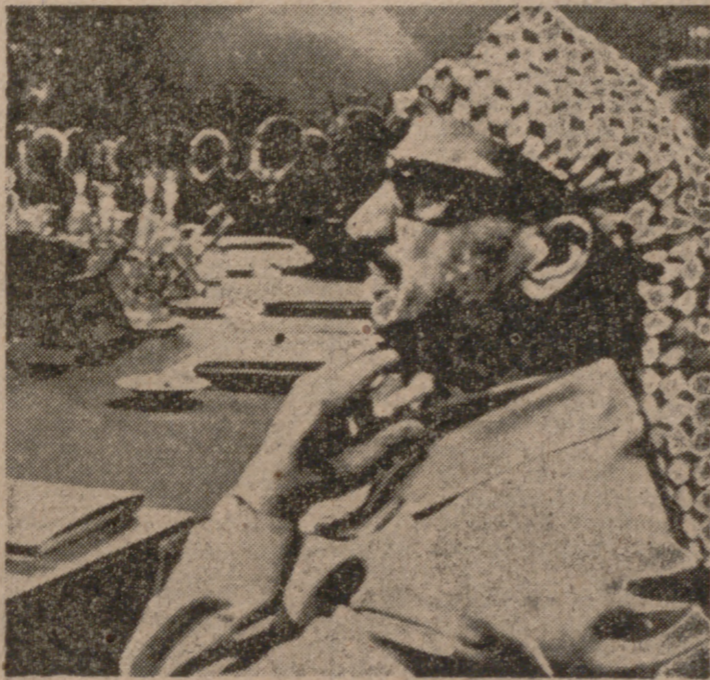
RABAT (Marruecos).—El líder de la Organización de Palestina, Yasser Arafat, en la sesión de apertura de la VII Cumbre Árabe, en el Hotel Hilton de Rabat.

La cuestión de los palestinos tuvo la culpa