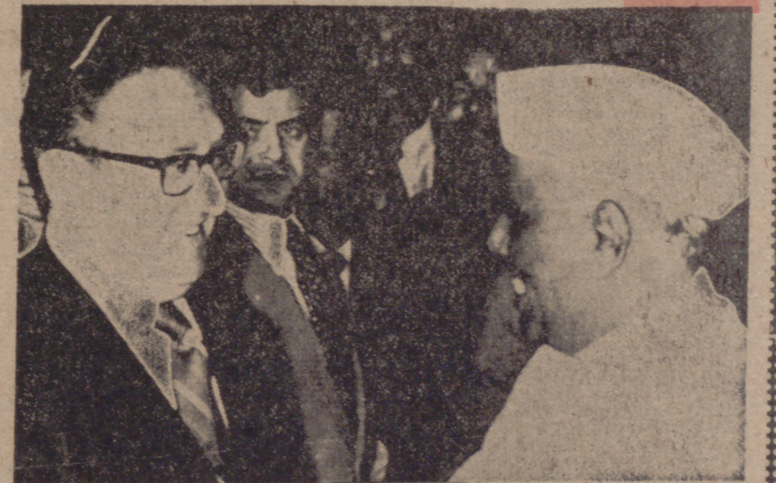
NUEVA DELHI.—La foto corresponde a la llegada de Henry Kissinger a Nueva Delhi, en una de las etapas del viaje que ahora realiza.