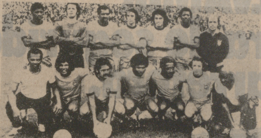
Brasil, sin haber marcado un gol todavía, tiene prácticamente asegurada su clasificación. Le basta con ganar por 3-0 a Zaire.