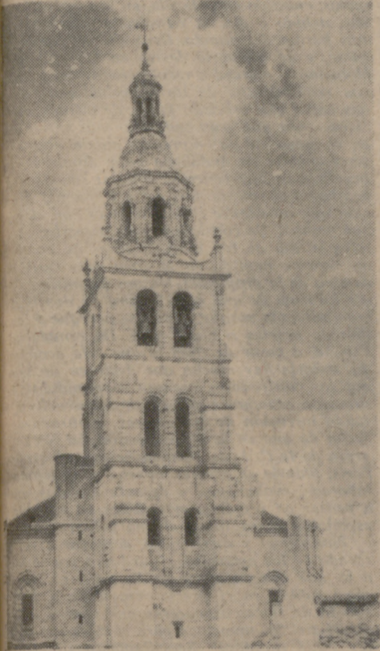
IGLESIA DE SANTA MARIA.

IX Exposición Agraria Comercial e Industrial para Tierra de Campos