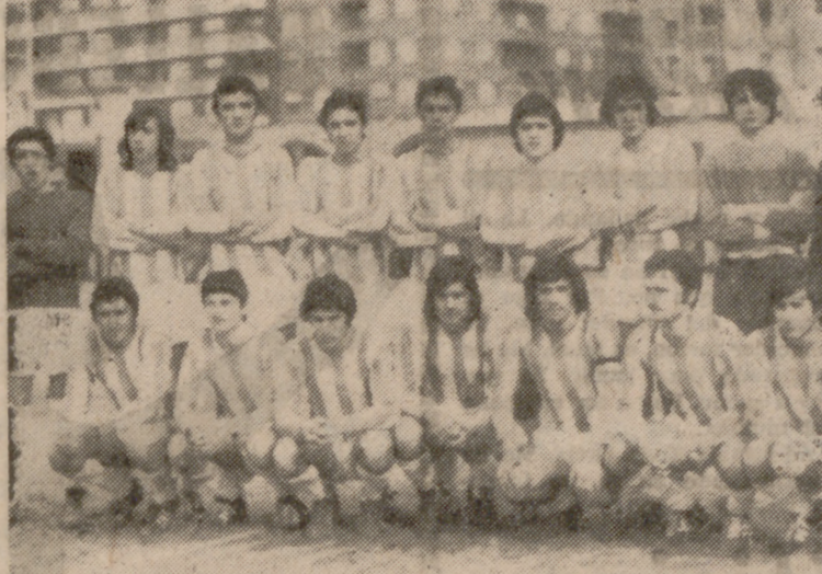
El Real Valladolid, aunque luchó mucho y no se dio por vencido en ningún momento, tuvo que inclinarse al final ante el mejor juego del Cristo Rey.