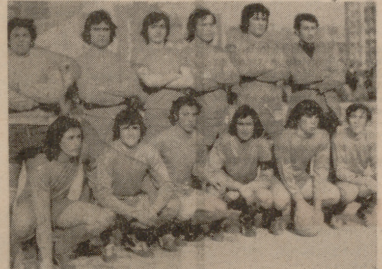
Por fin pudo ganar una final el Cristo Rey "A". Con merecimientos se impuso al Real Valladolid y se proclamó campeón juvenil.

tos, al tirar Pepe en buena posición, pero Camino, en su salida, logra despejar. Con este resultado se llega al descanso.