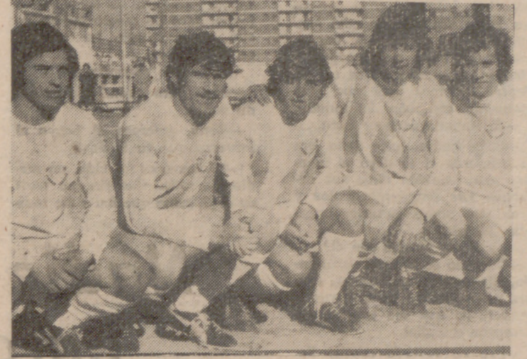
La delantera del Real Valladolid, que fue pieza importante en el triunfo de su equipo sobre el San Pedro Regalado.

tendría su gran oportunidad de marcar a los treinta y nueve minutos, gracias a un penalty hecho por el guardameta Vázquez a Rusillo. Se encarga de lanzarlo Rusillo y desvía muy bien Vázquez.