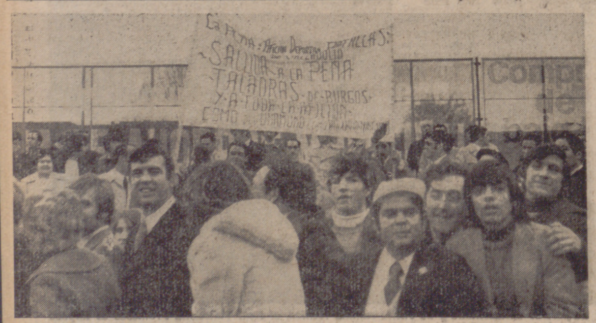
SEGUIDORES.—No faltaron seguidores vallisoletanos en Burgos. Algunos con pancarta, como este grupo que ha captado el fotógrafo. Los aficionados vallisoletanos alentaron al principio, pero luego fueron apagados por el orfeón local.