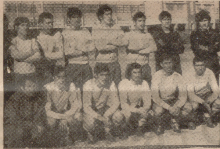
El Fasa, con su triunfo sobre el Victoria, se ha encaramado en el primer puesto.

A los cuarenta y dos minutos de la primera parte amonestó el árbitro a Rusillo por protestar. En la segunda mitad continúa la misma tónica de juego, aunque el Sava