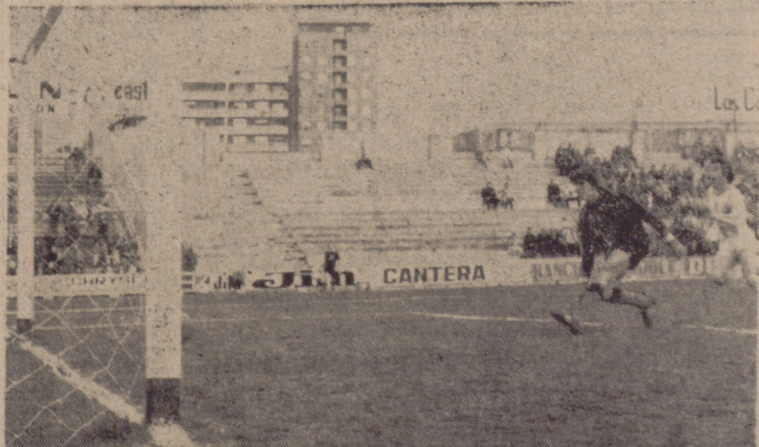
En un partido emocionante y de buena calidad técnica, el Real Valladolid Promesas se impuso con merecimiento a un Béjar que dejó constancia de su buen fútbol, pero que careció de remate. En el grabado, el primer gol vallisoletano, conseguido por Pepín, en propia puerta, al intentar ceder a su portero, que contempla el inevitable desenlace de la desgraciada jugada.