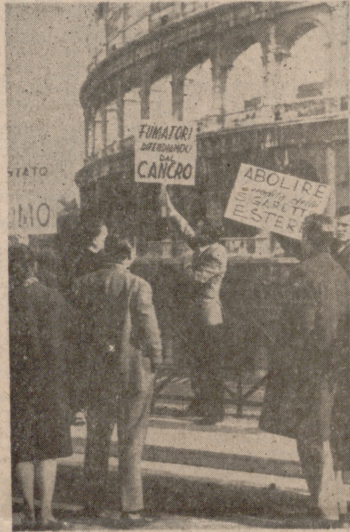
Ante los muros del Coliseo, algunos italianos se manifiestan contra el tabaco.

ta los Papas lanzaron buas castigando con la excomunión el vicio de fumar, pero todo ello pasó a la historia. Por unos u otros motivos, las prohibiciones, siempre concuadadas y nunca respetadas, se fueron levantando, las más de las veces porque el propio monarca se hizo fumador, como en el caso del zar Pedro III en Rusia, que levantó las penas y prohibiciones de sus antecesores por ser el mismo un gran fumador. Así, el tabaco se impuso y nadie tuvo fuerza suficiente, moral, física ni política, para impedirlo. Era algo unido a la sustancia del hombre mismo, prolongación de su persona, y había que exterminar al hombre o permitir que éste fumase.