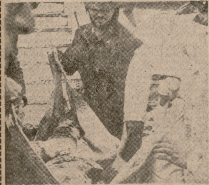
Los servicios del aeropuerto trasladan el cadáver de uno de los pasajeros del avión volado. (INFORMACION EN LA PAGINA SIGUIENTE)