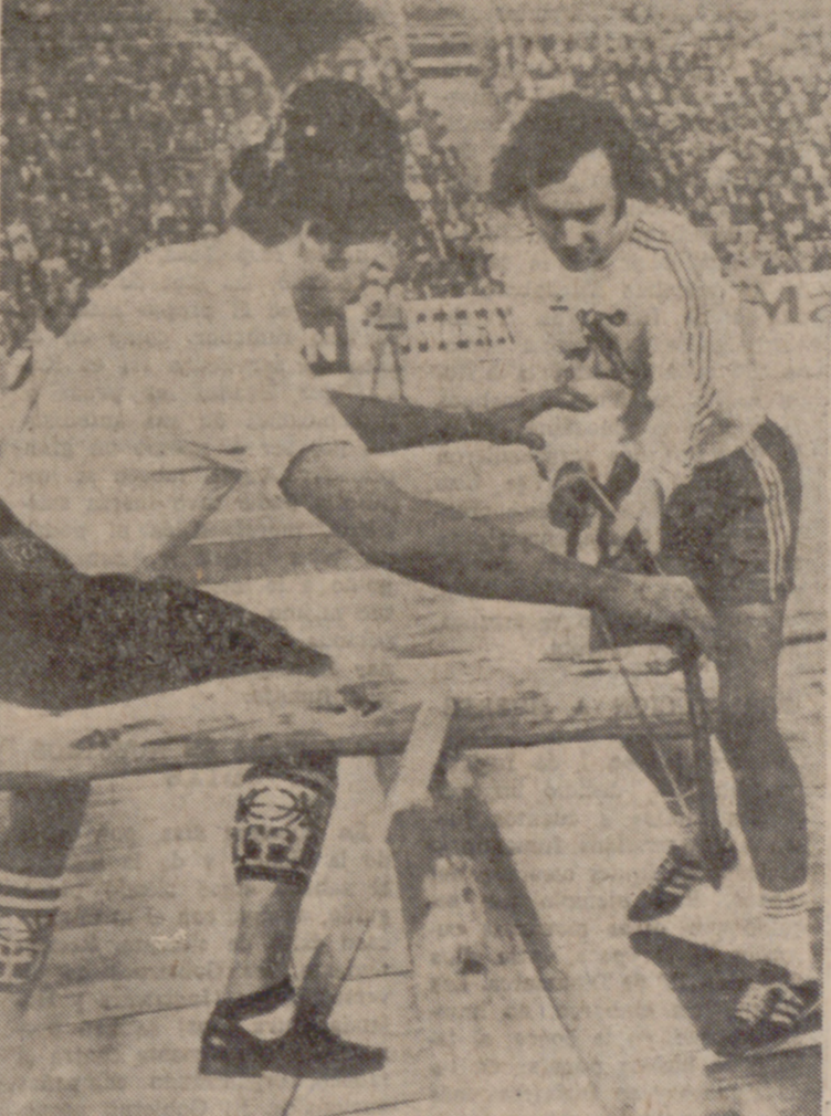
MUNICH.—Franz Beckenbauer, el capitán del Bayern Munich y del equipo nacional germano, no tiene dificultades para frenar a sus adversarios en el medio campo. Pero, en cambio, precisa la ayuda de un experto cuando se trata de cortar madera. Beckenbauer tomó parte en un festival deportivo en el Estadio Olímpico, donde puso de manifiesto que no es sólo el fútbol la actividad que practica bien, ya que se clasificó en segundo lugar en el lanzamiento de jabalina, tras el ganador de la medalla de oro olímpica, Klaus Wetermann.