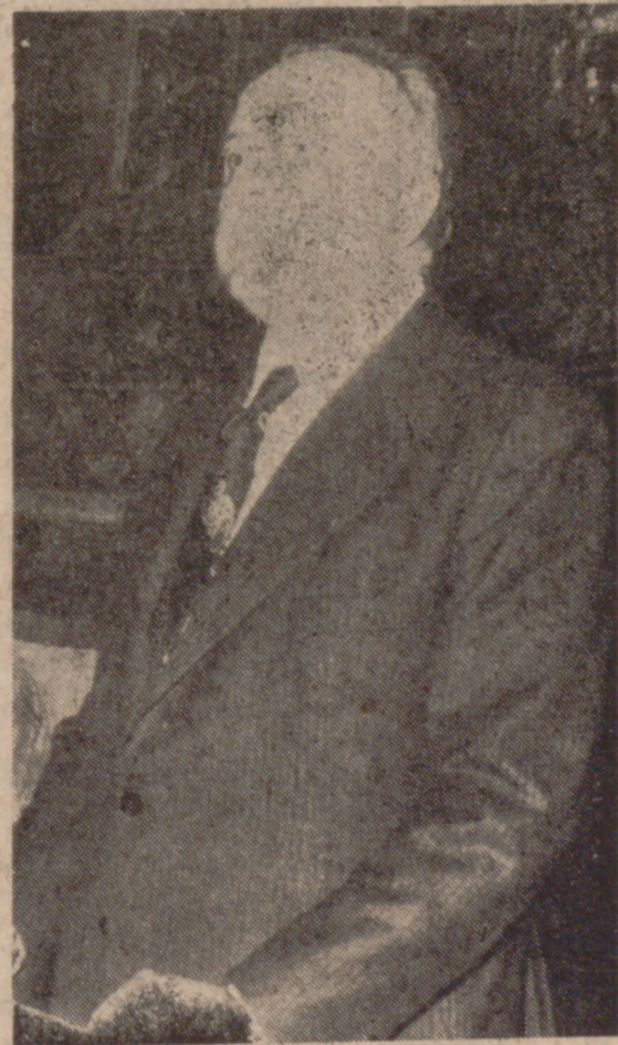
En la capilla del Museo Nacional de Escultura, y en un clima de expectación, pronunció ayer, a las ocho de la tarde, el Pregon de Navidad don Ricardo de la Cierva, director general de Cultura Popular. De este acto y de la rueda de Prensa que se celebró posteriormente ofrecemos información en tercera y quinta páginas.