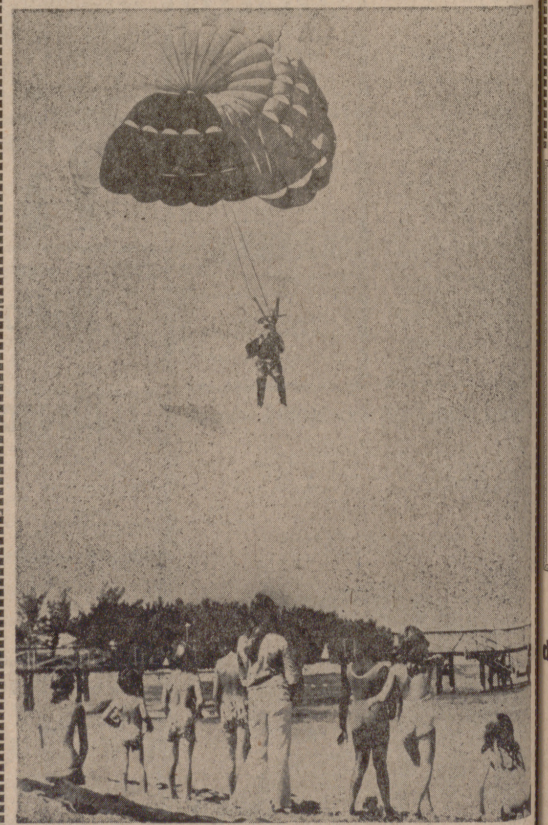
NASSAU (Bahamas).—Santa Claus se adapta al ritmo de los tiempos modernos. En lugar de descender por las chimeneas, se lanza en paracaídas sobre una playa de esta isla.