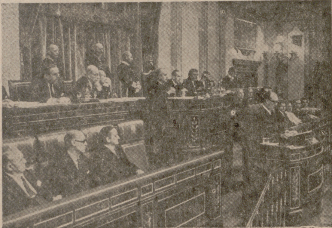
El Presidente del Gobierno, don Luis Carrero Blanco, pronunció un importante discurso ante el Pleno de las Cortes el día 20 de julio de 1973. En la fotografía, la Presidencia y la Mesa de las Cortes y una vista parcial del banco azul, reservado a los miembros del Gobierno.

Al margen de estas intervenciones, las Cortes han desarrollado un programa legislativo de cierta densidad, aunque las previsiones, los proyectos actualmente en el telar, lo han superado con creces. Así, las Cortes, en el declinar de 1973, tienen pendientes de discusión tres proyectos de ley de tan capital importancia como son el de Ley de Bases de Régimen Local, la reforma de la Ley del Suelo y los proyectos de las Leyes Orgánicas de la Justicia y de las Fuerzas Armadas. Este es el legado que en materia legislativa cede 1973 a su sucesor. Además, la celebración de sesiones informativas ha sido casi ininterrumpida; se constituyó la Comisión de Reglamento; disminuyó drásticamente el número de peticiones de suplenciones; se cursaron varias