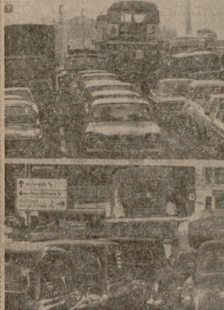
LONDRES.—Muchos problemas para los ingleses. En la foto grandes atascos de tráfico que se producen en la capital británica debido a la escasez de trenes motivada por la huelga de ferroviarios.—(Telefoto Cifra Gráfica-Upi.)

DRAMATICO LLAMAMIENTO DE HEATH A LA NACION LONDRES, 14. (PYRESA). En un dramático llamamiento a la nación en la Cámara de los Comunes, el Primer Ministro inglés ha establecido una serie de medidas de excepción que denotan la gravedad de la crisis económica en estos momentos en la Gran Bretaña. (Pasa a la pág. siguiente)