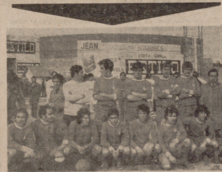
Formación del Sava, que ayer ganó por la mínima al Victoria.