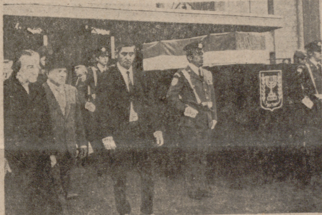
JERUSALEN.—La primera ministra de Israel, Golda Meir, cruza junto al féretro que contiene los restos mortales de David Ben Gurión, fundador del Estado israelita, instalado ante el Parlamento.