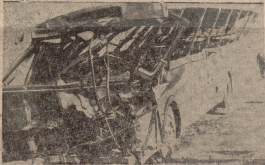
BARACALDO (Vizcaya). —Autobús de viajeros de la línea Baracaldo-Bilbao que cayó al río Galindo ayer por la mañana, hacia las siete y media, tras haber colisionado con un camión matrícula BI-107.711. Parece ser que la colisión se debió a la niebla. El camión quedó colgado en el vacío, tras romper la defensa de un puente. Seis muertos y unas setenta personas heridas es el balance de víctimas registrado hasta este momento.