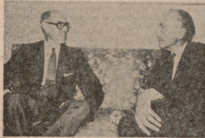
SEDE DE LAS NACIONES UNIDAS.—Un momento de la entrevista mantenida el jueves entre los ministros de Asuntos Exteriores de España, don Laureano López Rodó, y de Gran Bretaña, sir Alec Douglas-Home.

«Nuestro país colabora al restablecimiento de una paz estable y justa en Oriente Medio» Discurso de López-Rodó ante la Asamblea de las Naciones Unidas