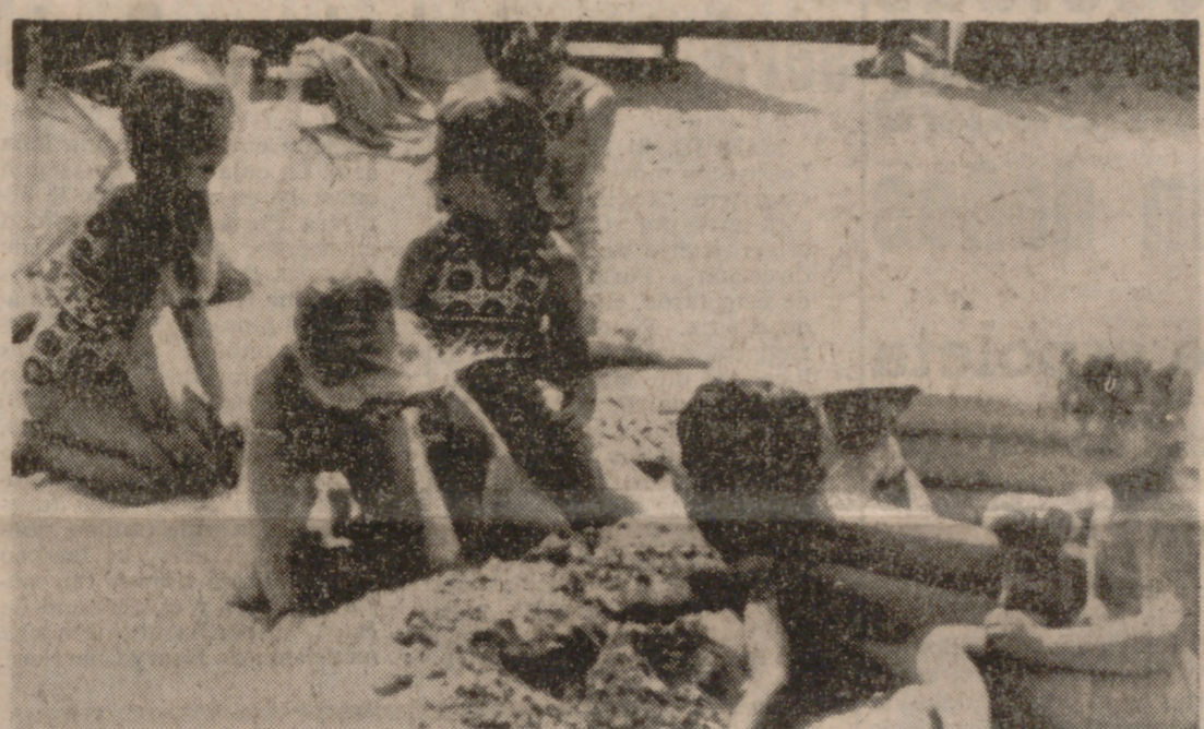
LA CORUÑA.—Los hijos de los Príncipes de España, nietos del Caudillo y el hijo de los Duques de Cádiz, disfrutan del soleado ambiente en sus juegos en la playa de Bastiaqueiro.