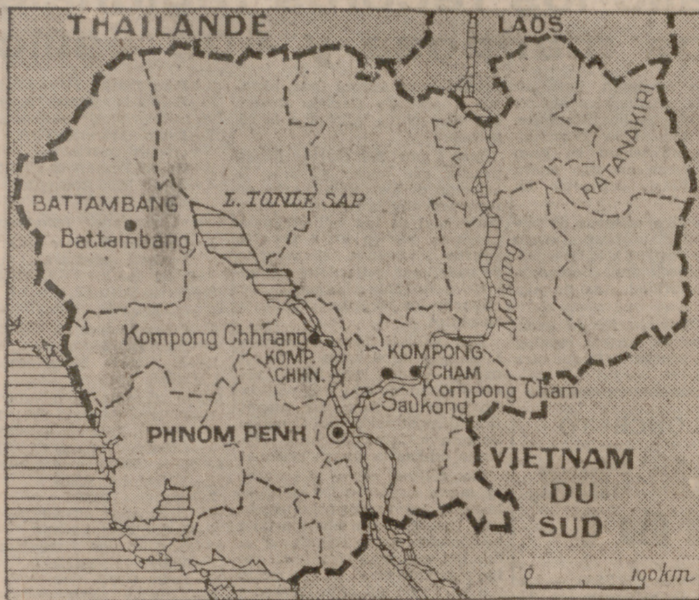
Mapa general de Camboya.

Hoy la ópera ha terminado, o al menos sirve de telón de fondo a un drama político y militar de repercusiones internacionales. Los khmers rojos han sustituido a los anteriores pro-