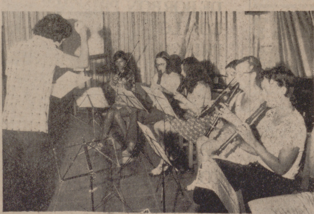
Clase de música en el Campo Internacional de El Chaparral.

De Calaburras (en cuyas aguas se decía que estaba Luludido el discutido portaviones «Ark Royal») hasta El Chaparral apenas hay tres kilómetros, pero, eso sí, un montón de curvas. No presentan problemas. Son curvas suaves y ancha la carretera. Justo en la que antecede (la curva) a las de La Butibamba está la entrada a El Chaparral. Tiene gracia esto de El Chaparral, porque lo cierto es que los chaparrinos no se ven ni por una apuesta. Uno pensaría más bien que El Chaparral es como un anfiteatro natural que arroja a la cala de su mismo nombre. Pero a lo que vamos. El Chaparral es noticia en la Costa del Sol porque resulta que aquí, tras unas leves colinas, se está llevando a cabo una experiencia artístico-cultural de carácter internacional y, por más señas, como primera en España. Dice un cartel que hay a la entrada, que El Chaparral es la sede del Primer Campo Internacional de Música y Pintura, de Mijas-Costa, claro, porque lo que nos queda por aclarar es que la experiencia se está realizando en el término municipal de Mijas, que pese a ser un pueblo serrano, también tiene mar; un mar muy limpio, que empieza en Calaburras y termina en Calahonda.