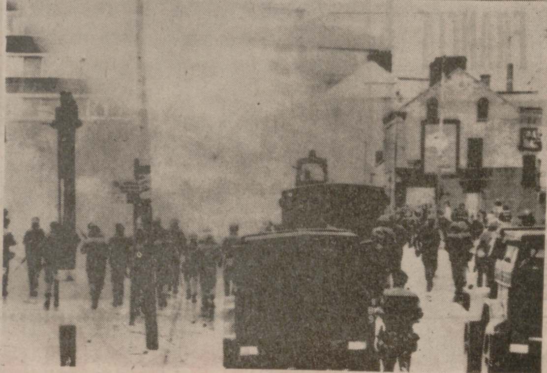
BELFAST.—Soldados con armas que disparan proyectiles de goma, protegidos por cañones de agua, dispersan una manifestación, de unas dos mil personas, que, desafiando una prohibición del Gobierno, pedían que dos dirigentes de la Democracia del Pueblo, que se hallan detenidos, tuvieran la condición de presos políticos. Dos soldados resultaron con ligeras lesiones y no hubo heridos entre los manifestantes.