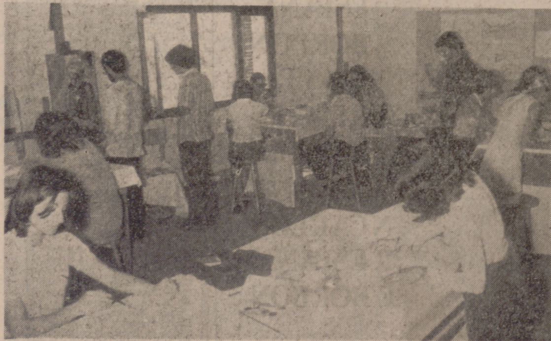
Españoles, suizos, franceses, belgas, argentinos, japoneses y marroquíes asisten al I Campo Internacional de Música y Pintura que la Sección Femenina celebra en estos días en la Costa del Sol.

Ha sido organizado por la Sección Femenina en colaboración con las Delegaciones de la Juventud y de Cultura