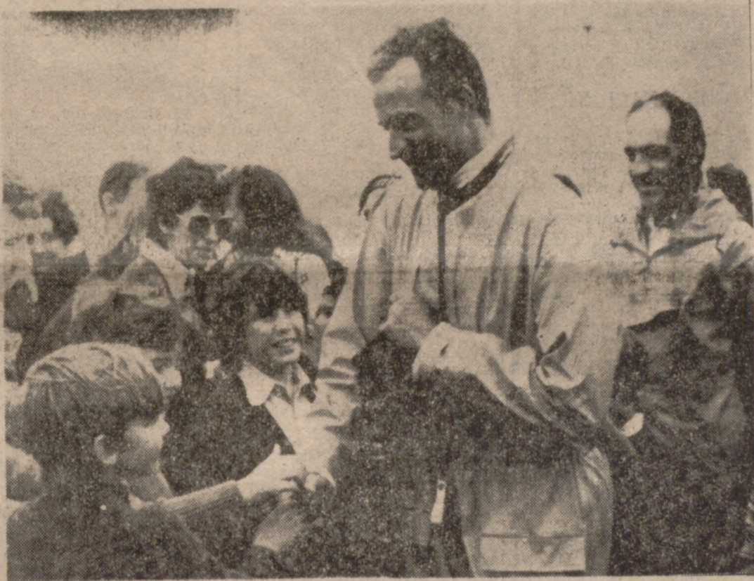
LAREDO (Sanander).—Sobre su yate "Fortuna", el Príncipe de España ha tomado parte en las pruebas de regatas de Laredo. En la fotografía, don Juan Carlos de Borbón es felicitado por unos pequeños al finalizar vencedor uno de las pruebas.