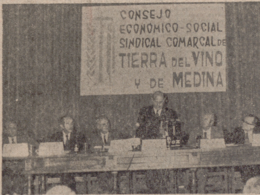
Con participación de más de doscientos consejeros, representando a los treinta y tres municipios de la comarca, se celebró en Medina del Campo el I Pleno del Consejo Económico-Social Sindical Comarcal de "Tierra del Vino y de Medina", presidido por el Gobernador Civil y Jefe Provincial. (INFORMACION EN PAGINAS INTERIORES)