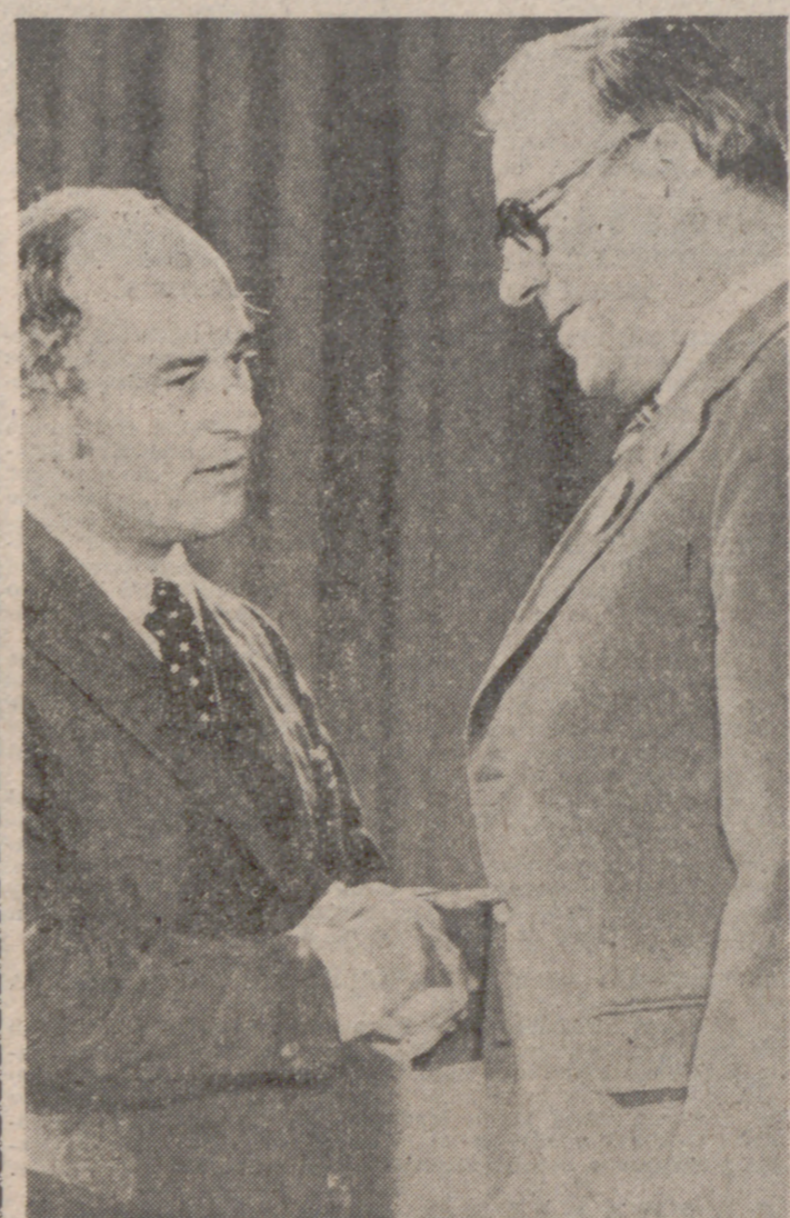
BONN.—Rainer Barzel (izquierda), que renunció a la Presidencia de la Unión Cristiano-Demócrata, saluda y felicita a Helmut Kohl, presidente del Gobierno de Renania-Palatina, por su elección como nuevo presidente de la Unión Cristiano-Demócrata en el curso de un congreso extraordinario en Bonn. Kohl consiguió 520 de los 621 votos electorales.