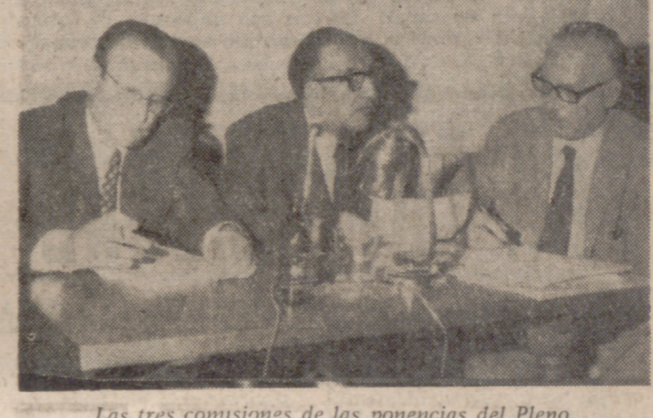
Las tres comisiones de las ponencias del Pleno.