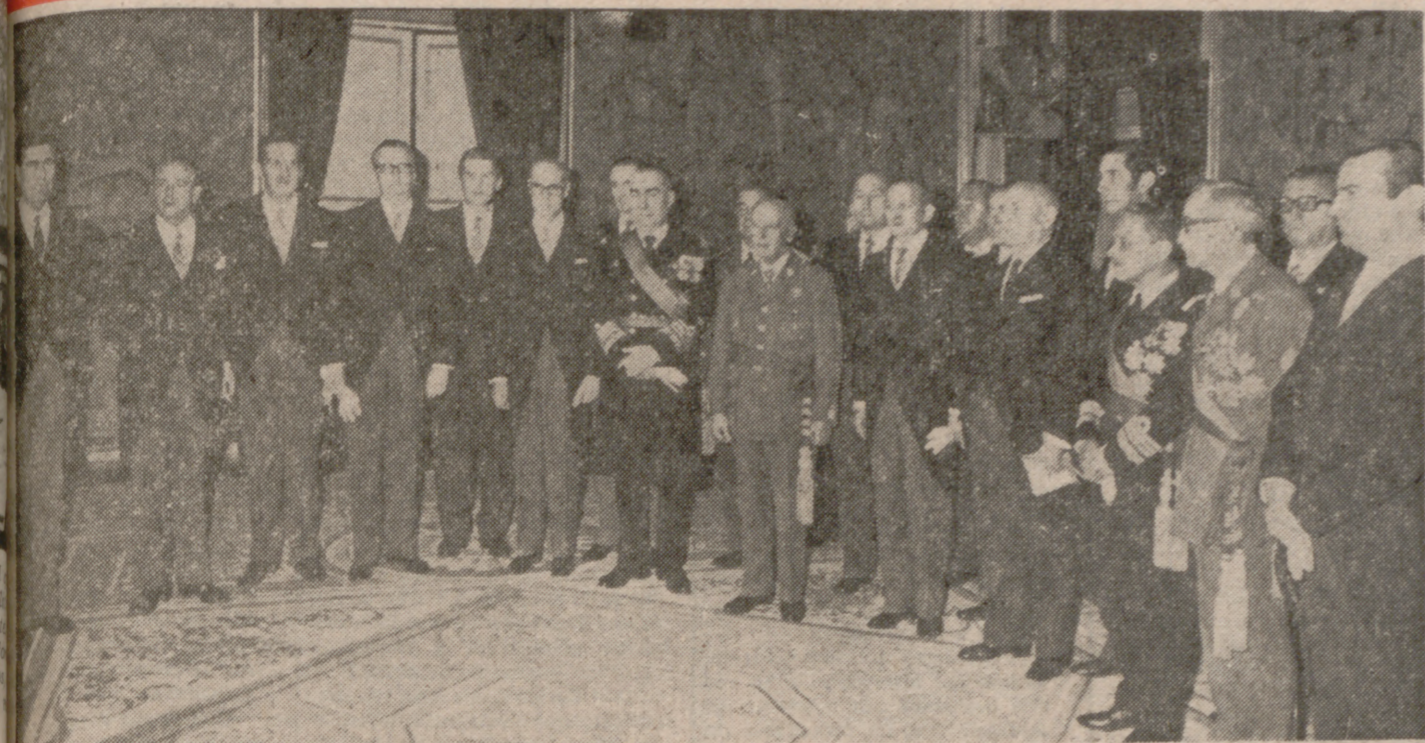
MADRID. — Los ministros del nuevo Gobierno español, con Su Excelencia el Jefe del Estado y el Presidente del Gobierno, almirante Carrero Blanco, después de jurar sus cargos en el Palacio de El Pardo.