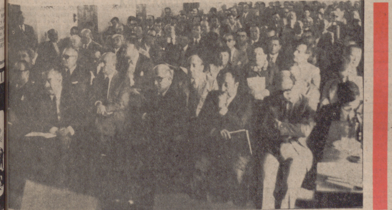
Más de doscientos consejeros asistieron a este I Pleno del Consejo Económico Social Sindical de "Tierra del Vino y de Medina". Cinco horas largas duraron las deliberaciones, especialmente interesantes para encauzar el desarrollo de la comarca.