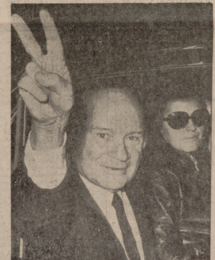
MADRID.—El Vicepresidente electo argentino saluda al público, poco después de su llegada a Barajas.

MADRID, 5. (PYRESA).—«Las relaciones entre España y Argentina siempre fueron cordiales y siempre lo serán, y más si cabe tras la visita del Presidente electo, Héctor José Cámpora, después de la que se acentuarán las económicas, ya que España es tan próspera y tiene grandes reservas de capitales que pueden influir decisivamente en el destino de Argentina», declaró a los periodistas el Vicepresidente electo argentino, don Vicente Solano Lima, que llegó a primera hora de la tarde de ayer a Madrid, procedente de Buenos Aires.