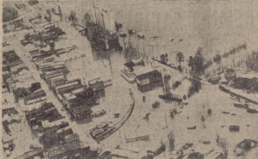
HANNIBAL (Mo, Estados Unidos).—La presente vista aérea muestra la zona central de Hannibal, inundada por las aguas del desbordado río Mississippi. Se informa que se han registrado inundaciones a lo largo del río, entre Dubuque y Nueva Orleans.