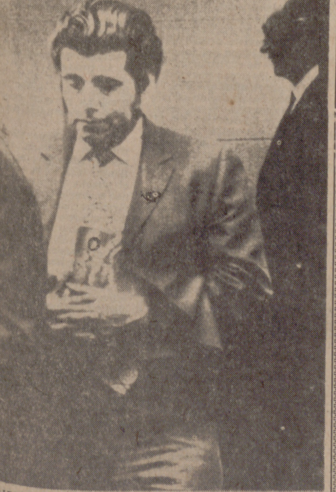
FAIRFIELD (California).—Juan Corona es trasladado de la Sala de Justicia del Condado de Solano a un vehículo de la Policía, el jueves, tras haber decidido el Jurado su culpabilidad en el asesinato de veinticinco agricultores.