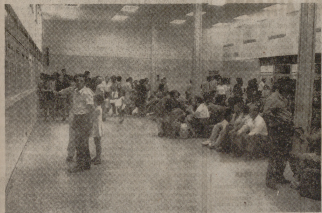
PUBLICO ANTE LAS TAQUILLAS DE BILLETES