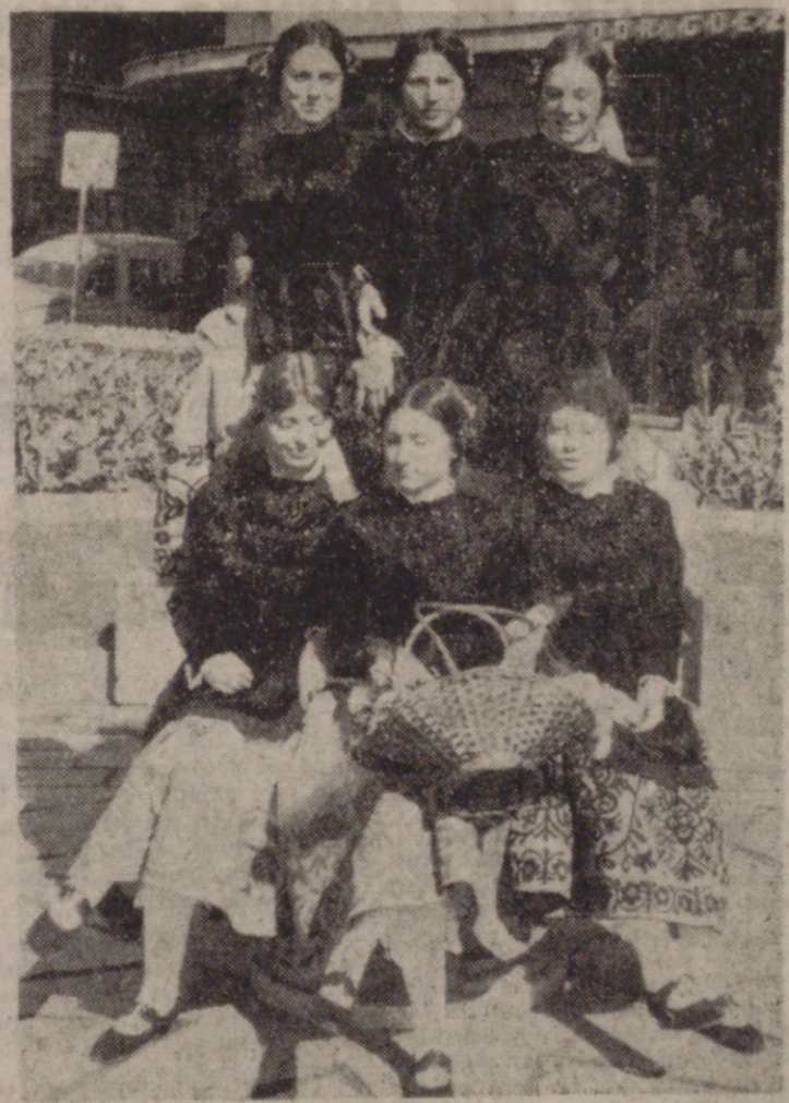
Muchachas de la Sección Femenina ataviadas con trajes regionales, dieron esta mañana la bienvenida a los turistas a las puertas de la Oficina de Información. (AMPLIA INFORMACION EN PAGINA TERCERA)