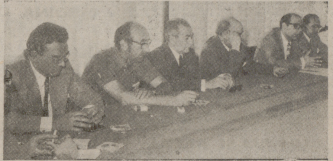
Un momento de la reunión informativa presida por el Delegado Provincial de Información y Turismo.

La Cruz Roja tiene montado su equipo de asistencia en el propio vestíbulo de la Feria de Muestras, junto a la Oficina de Turismo, varias enfermeras y socorristas, así como practicantes y médico, atenderán cualquier petición de ayuda de los automovilistas que atraviesar la ciudad. Por su parte, la Cruz Roja cuenta, desde hace seis años, con unas patrullas repartidas por