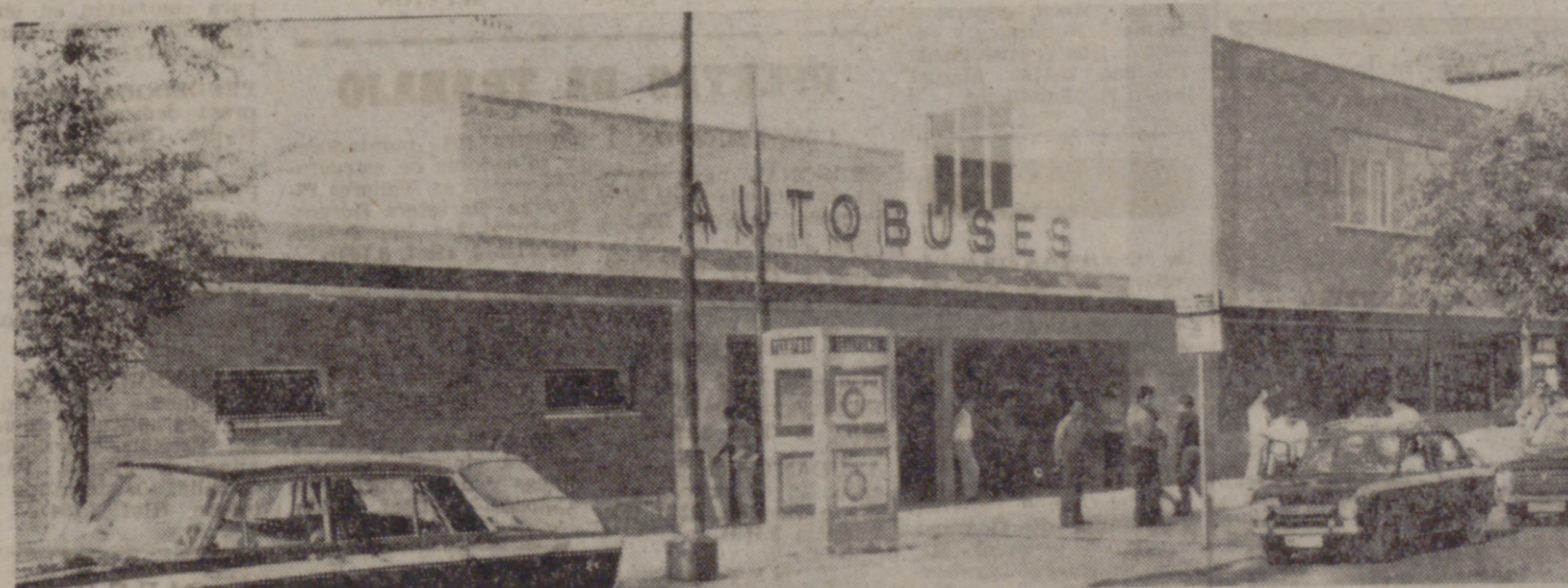
ENTRADA A LA ESTACION

un "standard" apropiado. Esta es la justificación principal para la implantación del restaurante, de la cafetería, tiendas y demás servicios públicos descritos anteriormente. Por otra parte, se consigue que, de alguna manera y cantidad, los gastos de conservación de las instalaciones recaigan sobre los propios beneficiados por ellas, puesto que, de no existir, el único ingreso provendría de los tradicionales billetes de andén, o de los gravámenes a los con-