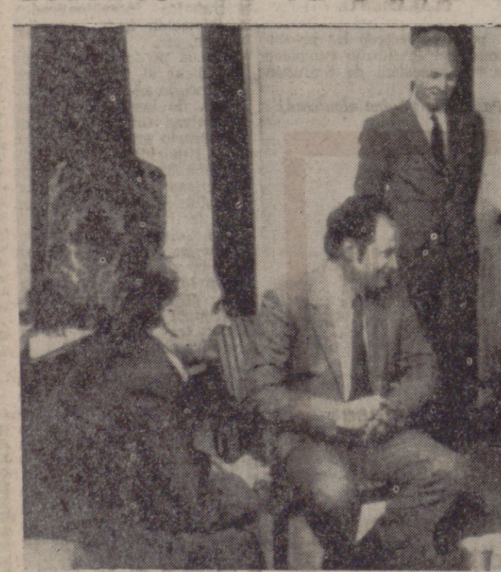
LA HAYA (Holanda).— El ministro español de Trabajo Licinio de la Fuente que se encuentra en Holanda, se ha entrevistado con su colega holandés de Bienestar, Boersma...