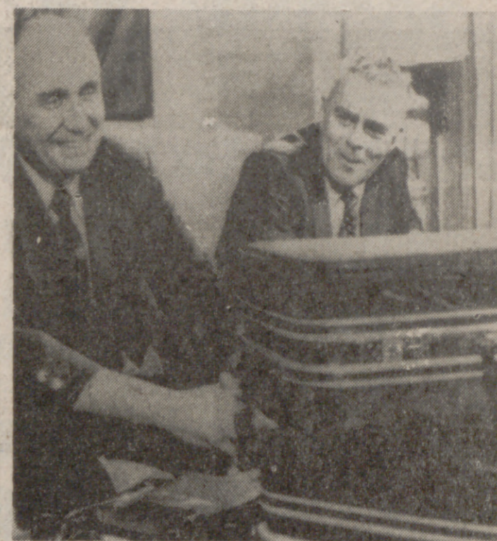
WASHINGTON. — Dos jefes de la compañía de aviación "Delta" acaban de regresar desde París, con esas dos maletas que se ven en primer término, llenas de billetes...