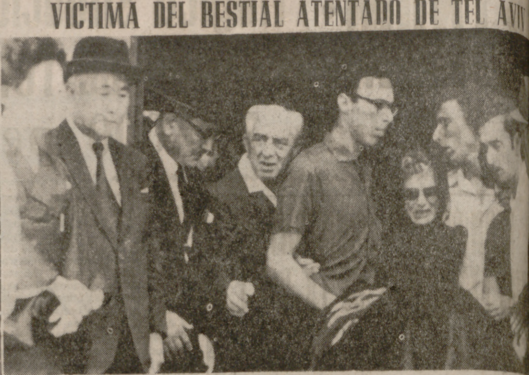
REHOVOT (Israel).—El embajador del Japón, Eigi Tokura (izquierda), y su esposa, en las funerales por el profesor Katzir, muerto en el aeropuerto de Lod durante el ataque perpetrado por tres japoneses el martes. Los parientes del finado proceden a sacar el féretro.

PHNOM PENH, 5. (Efe-Reuters). Los camboyanos han votado ayer en gran número en las elecciones presidenciales que darán al país el primer jefe de Estado electo en sus mil años de historia. Largas filas de camboyanos aguardaron turno en los colegios electorales desde que comenzó la hora de la votación para obtener fotografías de los tres candidatos, que se utilizan en la votación en vez de papeletas de voto. Se espera que la elección —la segunda que se celebra en cinco semanas— confirmará la jefatura de Lon Nol en el país.