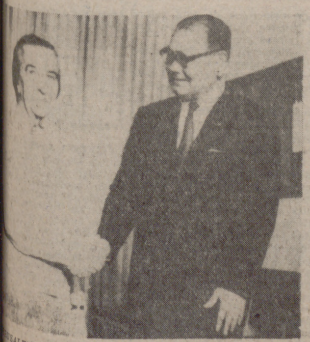
SAIGON.—El enviado japonés, Kenji Fukunaga, estrecha la mano de la primera ministra de Israel, Golda Meir, momentos antes de iniciar las conversaciones.