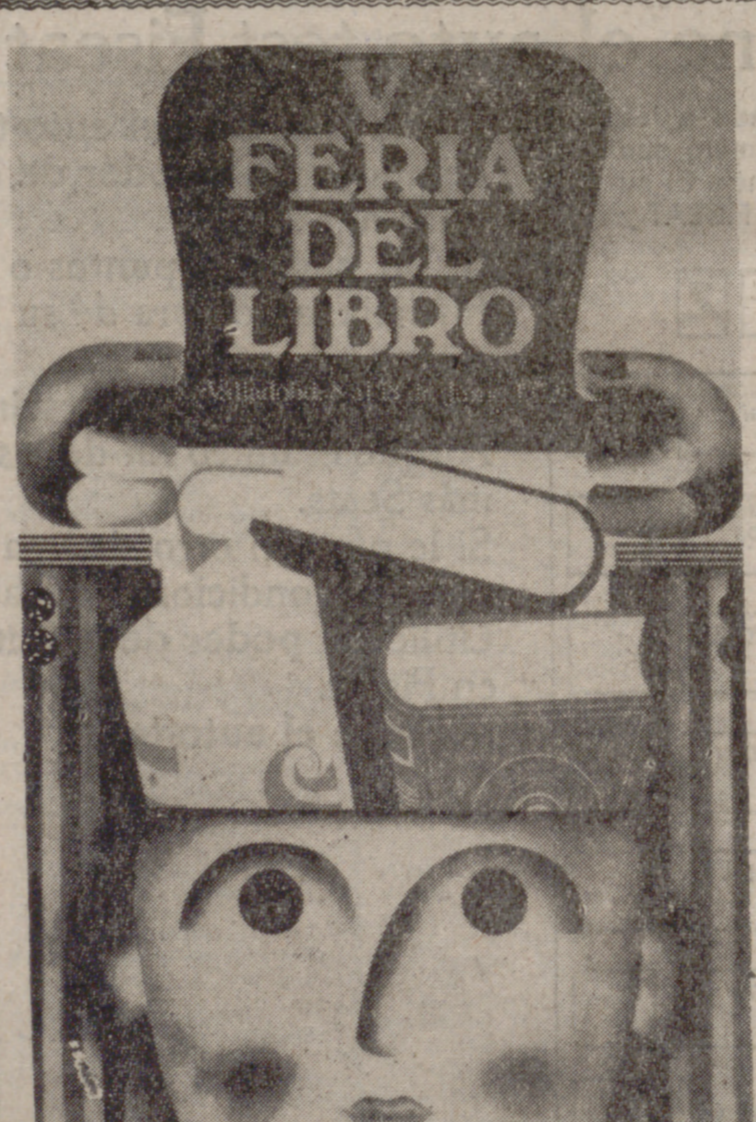
Cartel anunciador de la V Feria Nacional del Libro, de próxima celebración en Valladolid.