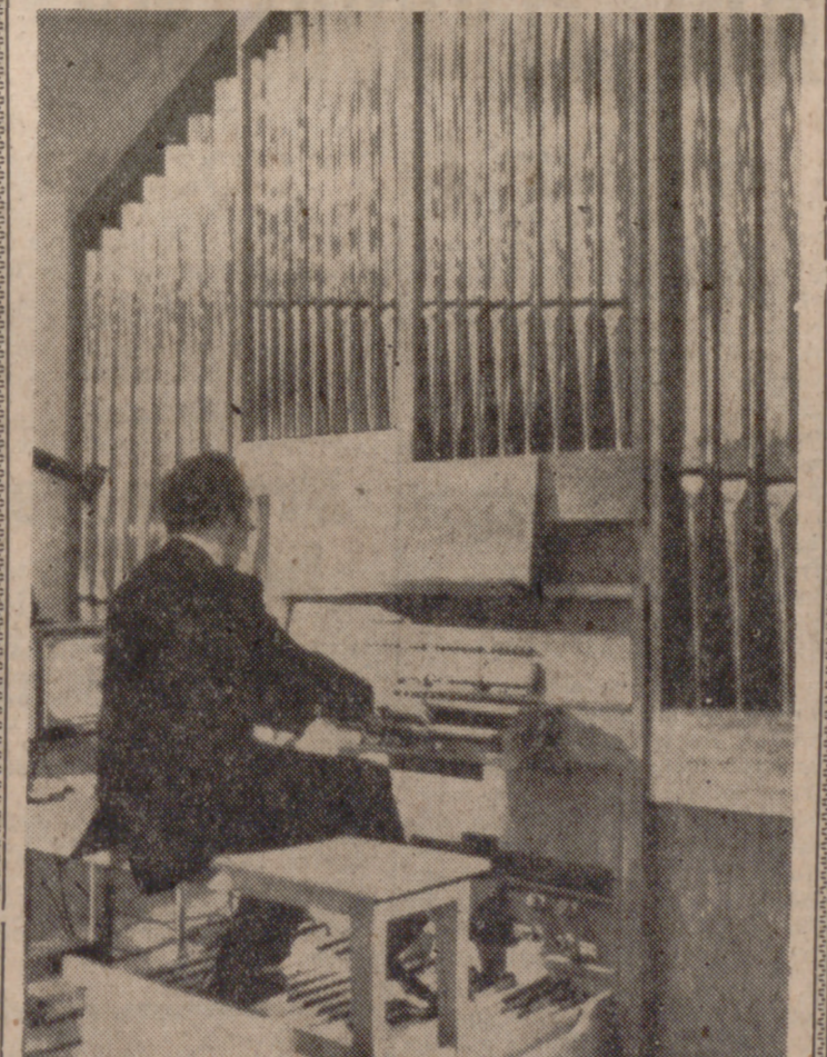
ZURICH.—El primer órgano del mundo para sordos fue inaugurado el domingo pasado en la "iglesia para sordos" de esta ciudad. Si se comparan con los tubos de los órganos normales, los de este son extraordinariamente gruesos en toda su longitud. Con ello se consigue una total vibración que puede ser captada por los sordos.