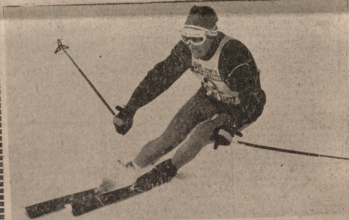
Jean Claude Killy, última gran figura francesa del esquí, que tuvo su momento en la Olimpiada de Grenoble.

El éxito de esta primera edición de los Juegos alentó a los organizadores a cuidar más los detalles en la siguiente Olimpiada Blanca, que tuvo lugar en Saint-Moritz, entre el 11 y el 18 de febrero de 1928. Participaron más atletas: 491 y más naciones: veinticinco, y el éxito superó en mucho al esperanzador comienzo en Chamonix.