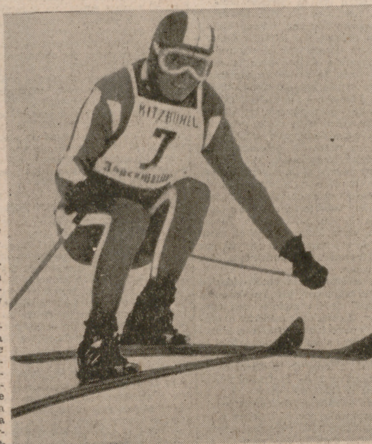
Toni Sailer, un superclase del esquí que brilló grandemente en los Juegos Olímpicos de Cortina d'Ampezzo.

Se incluyen en el programa las pruebas de relevos en esquí y la combinada alpina para ambas categorías. Las victorias están repartidas y no hay supremacías acusadas, brillando el