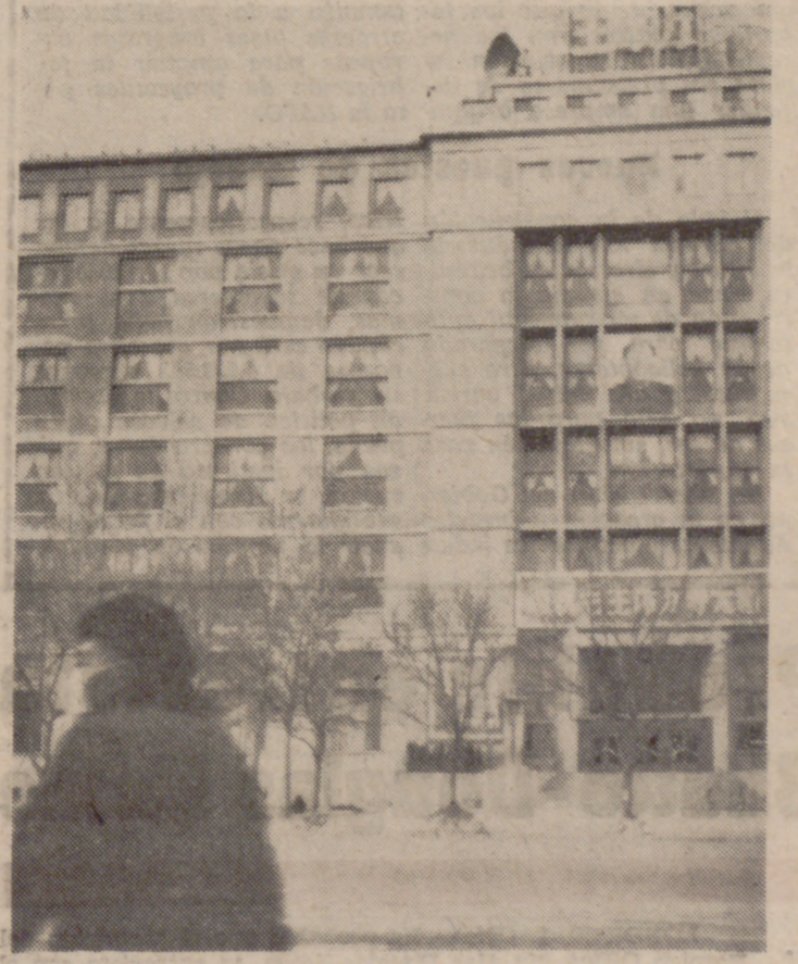
PEKIN.—El Centro de Prensa para la visita del Presidente Richard Nixon a la China continental será instalado en el edificio de Comunicaciones (Correos, Teléfonos y Telégrafos) que capta la foto, pero no se han realizado aún los preparativos. El ciclista que aparece en primer plano (izquierda) lleva tapada la boca con una máscara, debido al intenso frío reinante, inferior a los 15 grados centígrados bajo cero.