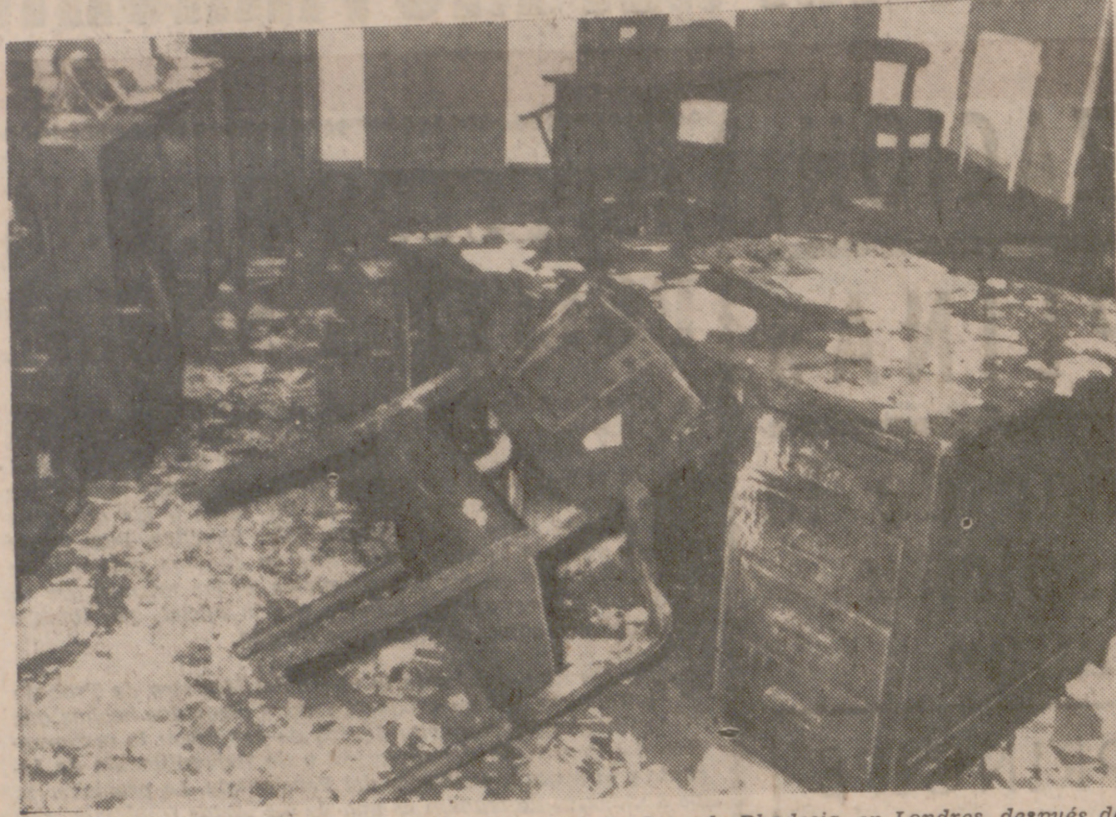
LONDRES.—Daños causados en las oficinas de la Casa de Rhodesia, en Londres, después del incendio provocado a causa del lanzamiento en su interior de dos bombas de gasolina.