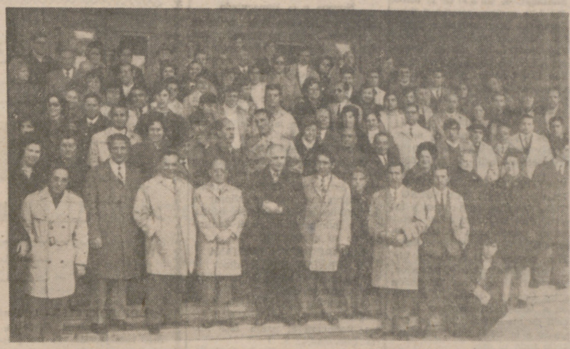
Los fontaneros y calefactores, a la salida de la misa.

El Grupo Sindical de Instaladores de Calefacción y Fontanería ha celebrado hoy diversos actos en honor de su Patrón, San Eloy.