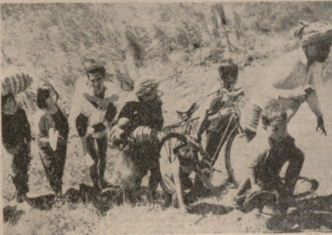
KREK (Camboya).—Un grupo de refugiados transporta sus mercancías, incluida la bicicleta, después de abandonar su localidad, situada a diez millas de Krek, tras el enfrentamiento fronterizo entre tropas de Vietnam del Norte y Vietnam del Sur.