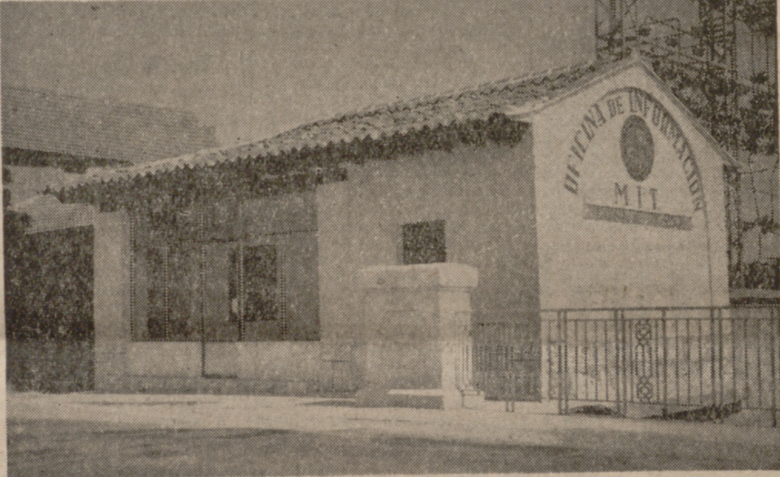
(De nuestro corresponsal, J. M. R.)

Bajo la presidencia del señor Fuentes Hernández se reunió el Centro de Iniciativas y Turismo «Ajujar».